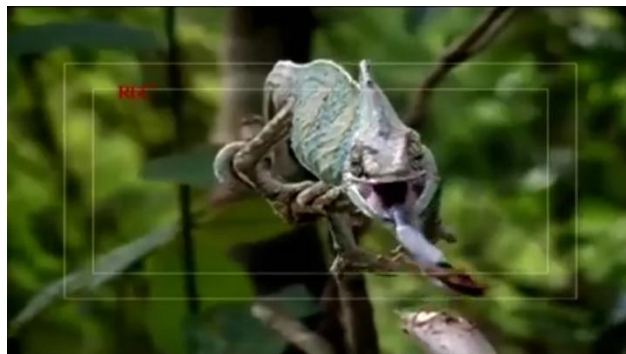
GAMBAR 4. Salah Satu Episode Tayangan Dunia Binatang

Tayangan dunia binatang tidak hanya memberikan pengetahuan mengenai satwa-satwa yang belum pernah dilihat oleh anak-anak, tetapi juga menampilkan bagaimana cara merawat, menjaga dan memberi makan kepada satwa-satwa tersebut.