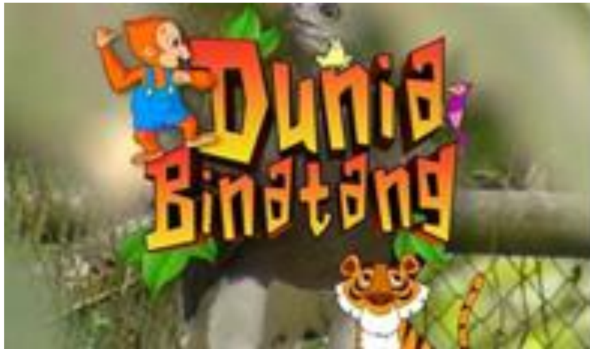
GAMBAR 3. Logo Program

Salah satu contoh dari program informasi yang tayang ditelvisi yaitu program Dunia Binatang “Si Otan” di Trans 7. Dunia Binatang “Si Otan” adalah program edukasi untuk anak-anak yang ditayangkan diTrans7. Program tersebut menyajikan ilmu pengetahuan, eksperimen , mengamati dan mengenali berbagai hal yang berhubungan dengan hewan yang dijadikan sebagai cara mendidik anak-anak dan belajar untuk mengenal berbagai macam hewan baik yang di dalam air, di dasar maupun yang di udara. “Dunia Binatang” tayang pada hari jumat pukul 13.30 WIB 14 .