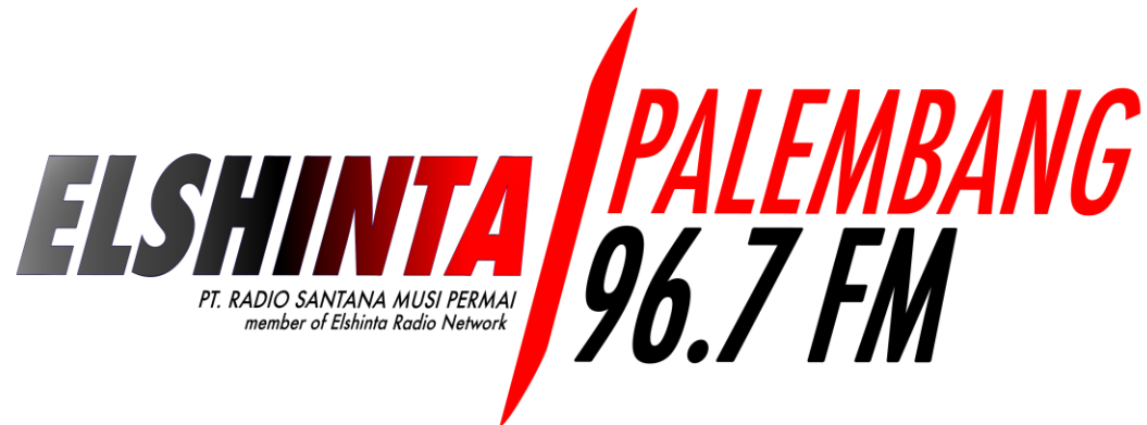
Gambar 3.2. Logo Radio Elshinta Palembang

Radio Elshinta memiliki logo yang dominan dengan warna biru dan hijau. Pada logo Radio Elshinta pun terdapat tiga elemen penting yang menerangkan tentang Elshinta pada umumnya, diantaranya sebagai berikut: