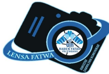
Gambar 3.1 Logo Fatwa Fotografi

Adapun logo diatas memiliki arti sebagai berikut :