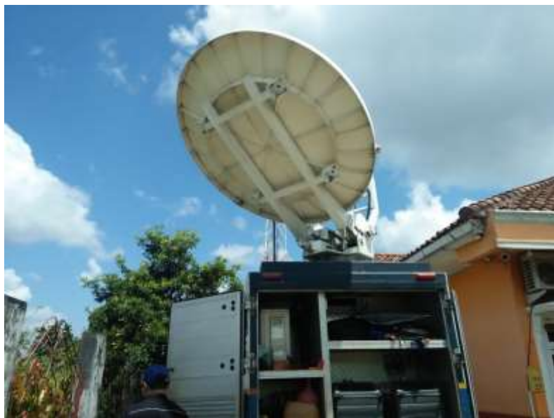
SATELITE YANG MENGIRIM DAN MENERIMA SINYAL ATAUPUN GAMBAR DI MOBIL SNG (SATELITE NEWS GATEHRING)