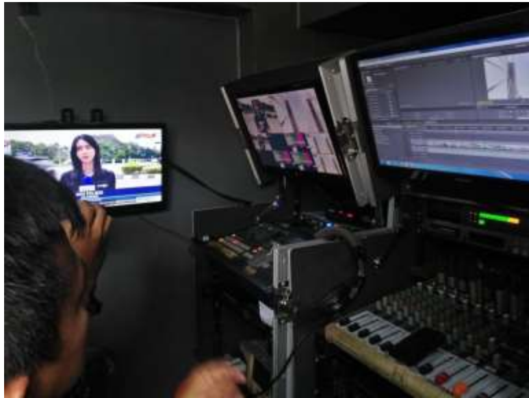
PENULIS DIPERLIHATKAN CARA MENGEDIT LIPUTAN LIVE BERITA DI DALAM MOBIL SATELITE NEWS GATEHRING (SNG)