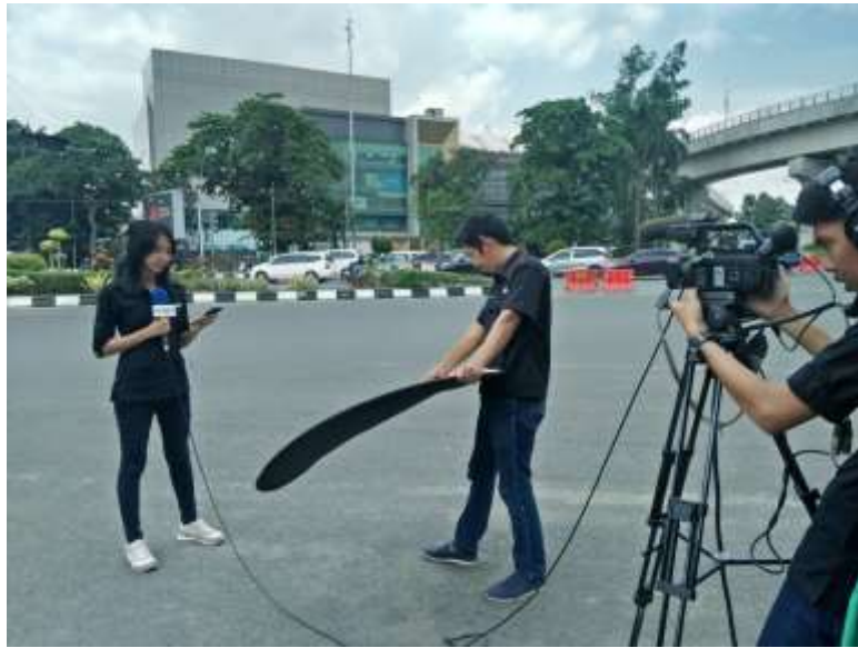
PENGAMBILAN BACKGROUND LIPUTAN BERITA LIVE TENTANG PERESMIAN JEMBATAN MUSI IV DI SIMPANG 5 DPRD