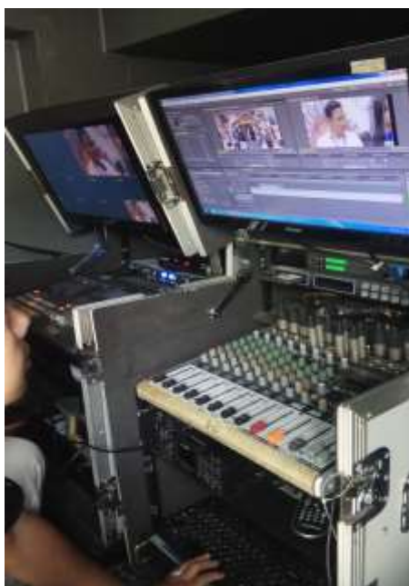
SOFTWARE DAN HARDWARE EDITING DI MOBIL SNJ ( SATELLITE NEWS GATEHRING)