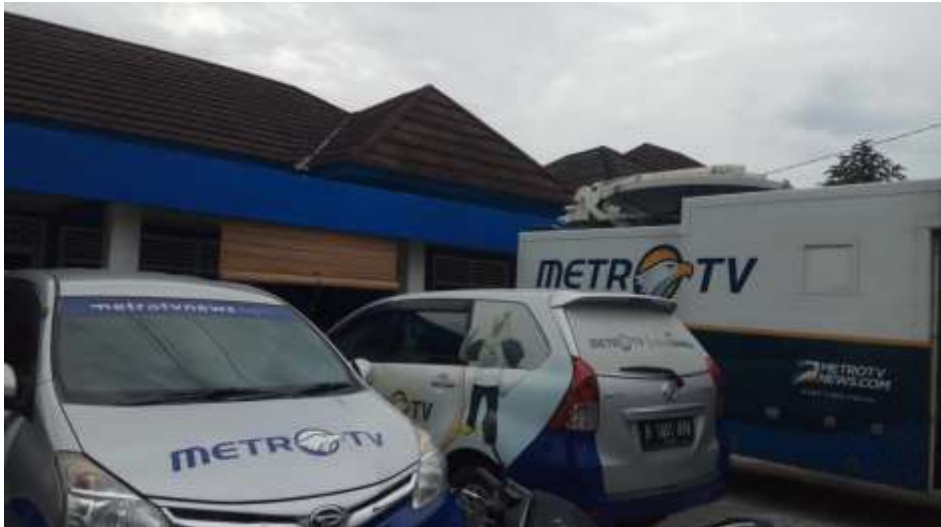
TAMPAK DEPAN KANTOR METRO TV BIRO PALEMBANG