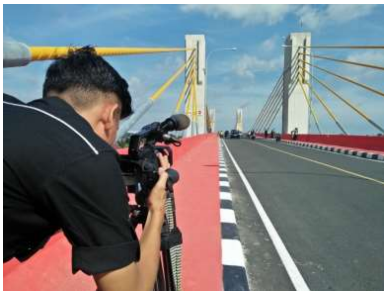
PENGAMBILAN GAMBAR DI JEMBATAN MUSI IV PALEMBANG