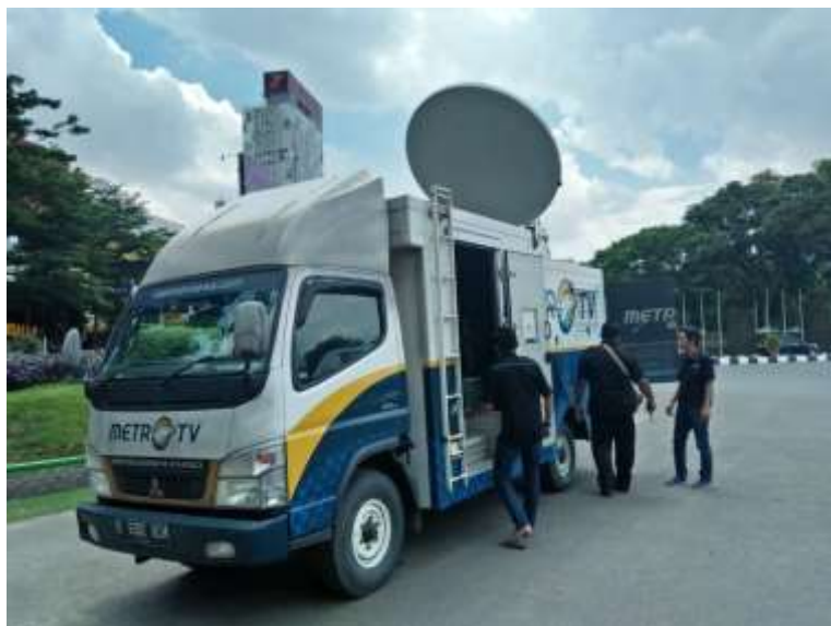
MOBIL SATELITE NEWS GATHREING (SNG) SAAT LIPUTAN LIVE PERESMIAN JEMBATAN MUSI IV PALEMBANG