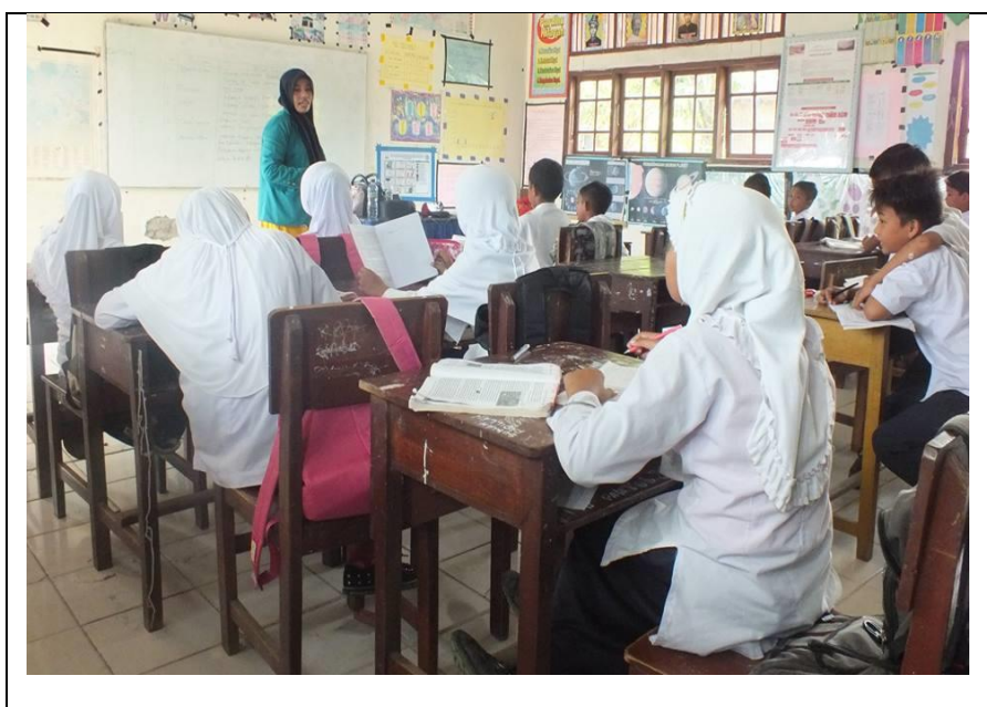
Gambar 4.1 pengelolaan tempat duduk yang biasa di terapkan oleh guru pada umumnya

Hal ini menunjukan bahwa pengelolaan tempat duduk disesuaikan terhadap kebutuhan serta situasi proses pembelajaran yang akan dilaksanakan. Adapun dari hasil pengamatan serta proses wawancara didapati bahwa guru yang berbeda melakukan pengelolaan kelas sesuai kebutuhan dari proses pembelajaran yang ingin diciptakan.