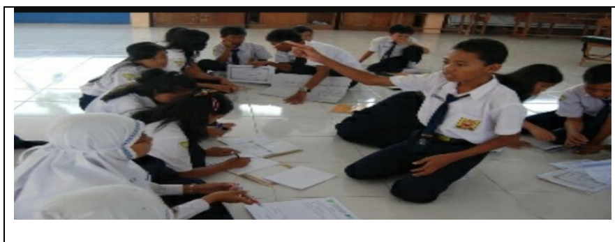
Gambar 4.2 inovasi pengelolaan kelas dengan tempat duduk lebih bervariasi sesuai dengan kebutuhan materi dan proses belajar yang di inginkan