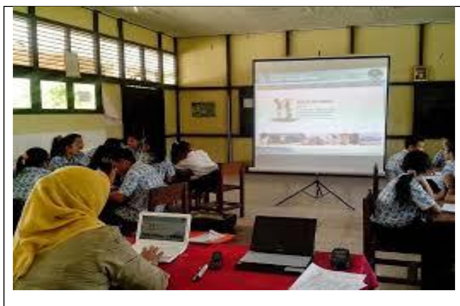
Gambar 4.5 proses kegiatan KBM dengan menggunakan proyektor

Gambar 4.5 menunjukkan inovasi guru PAI dalam melaksanakan proses pembelajaran selain dengan mempersiapkan RPP dengan baik secara keseluruhan sesuai dengan kebutuhan juga guru PAI mempersiapkan Proses pembelajaran dengan alat bantu proyektor untuk mengaktifkan dan efisien proses pembelajaran sebagai cerminan guru yang profesional.