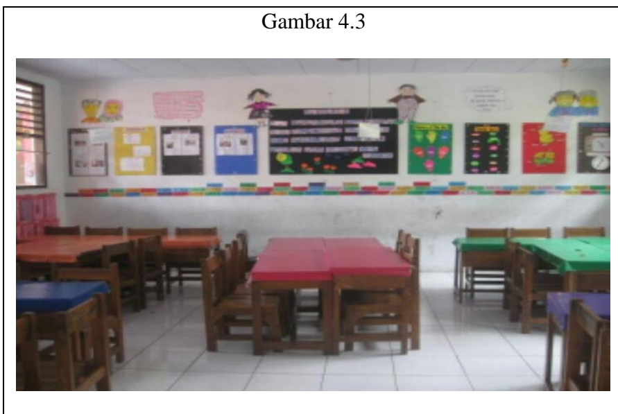
Gambar 4.3 inovasi pengelolaan kelas dari konvensional, monoton dan membosankan menjadi lebih inovatif dan kreatif

Dari keterangan di atas dapat disimpulkan bahwa profesional guru dalam pengelolaan kelas berarti sama halnya mengubah gaya belajar, tempat duduk yang konvensional adalah gaya belajar yang monoton, pola duduk bisa disesuaikan sesuai dengan materi yang disampaikan. Pengelolaan kelas merupakan keterampilan guru untuk menciptakan iklim pembelajaran yang kondusif. Inovasi guru dalam pengelolaan kelas ini dapat