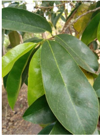
Gambar 1. Daun Sirsak

Tanaman sirsak mulai ada di kawasan benua Asia, diantaranya Malaysia, Thailand dan Indonesia sejak awal abad ke-19. Pada abad tersebut, tanaman sirsak masuk ke Indonesia dibawa oleh pemerintah Hindia Belanda untuk dibudidayakan. Sentra produksi sirsak pada waktu itu berada di daerah Raja Mandala ( Jawa Barat), Kabupaten Karanganyar (Jawa Tengah), dan Malang Selatan (Jawa Timur). Dari sentra produksi sirsak tersebut, selanjutnya menyebar ke berbagai pelosok negeri di Indonesia (Rukmana, 2015).