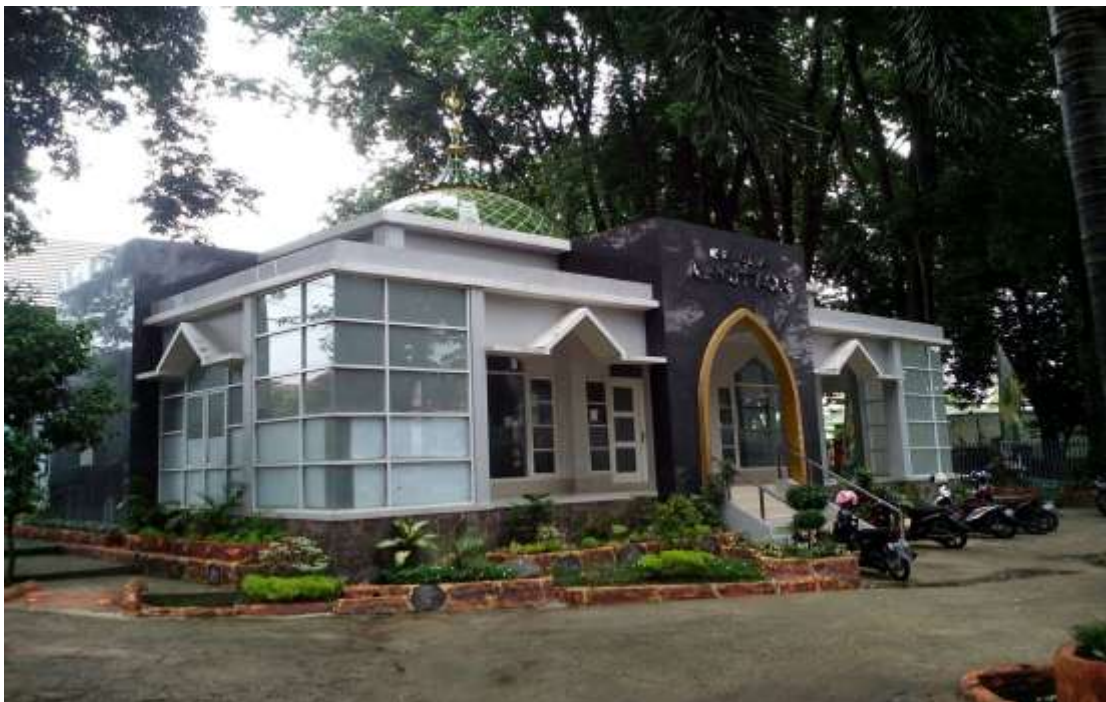
Gambar 4. Musholla Al-Muttaqin