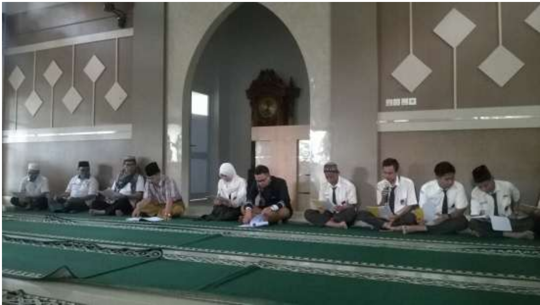
Gambar 1. Pembacaan Khataman Al-Qur'an