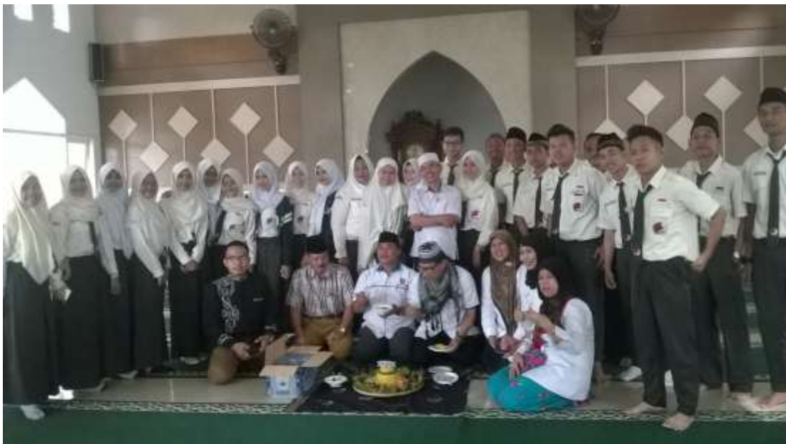
Gambar 2. Pematangan Nasi Tumpeng