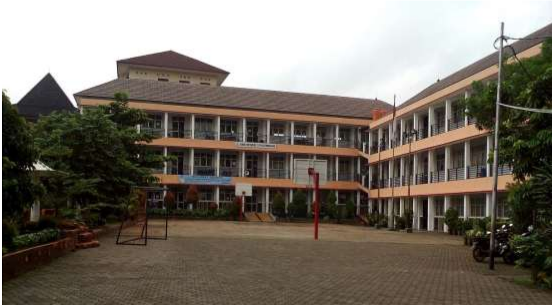
Gambar 3. Gedung SMA N 3 Palembang