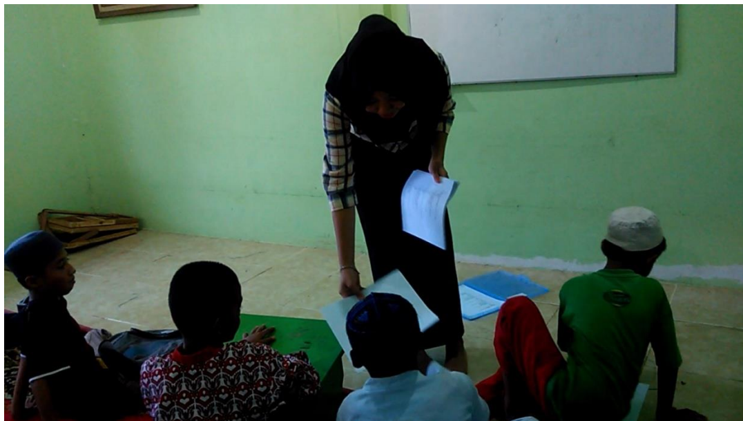
Pembagian soal tes kepada santri TPA Masjid Al-Fattah