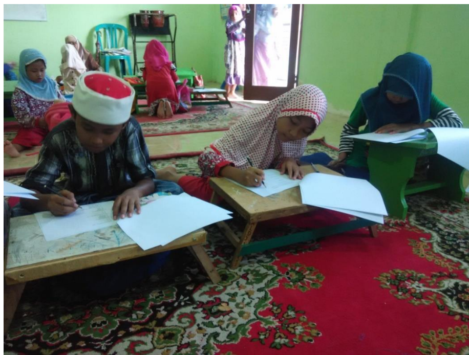
Tes Kemampuan Menulis Arab Tingkat Dasar