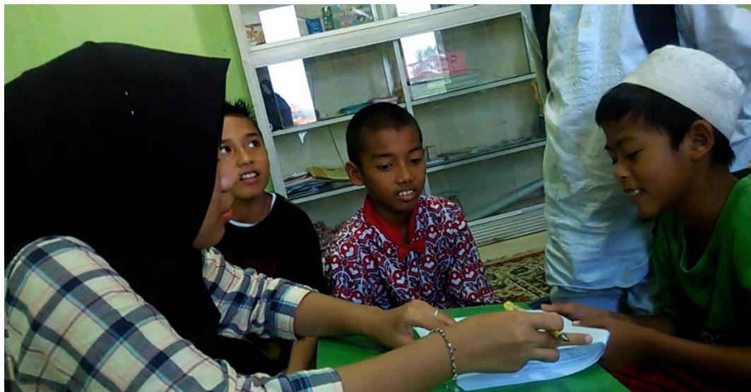
Tes Kemampuan Membaca Al-Qur'an Tingkat Dasar