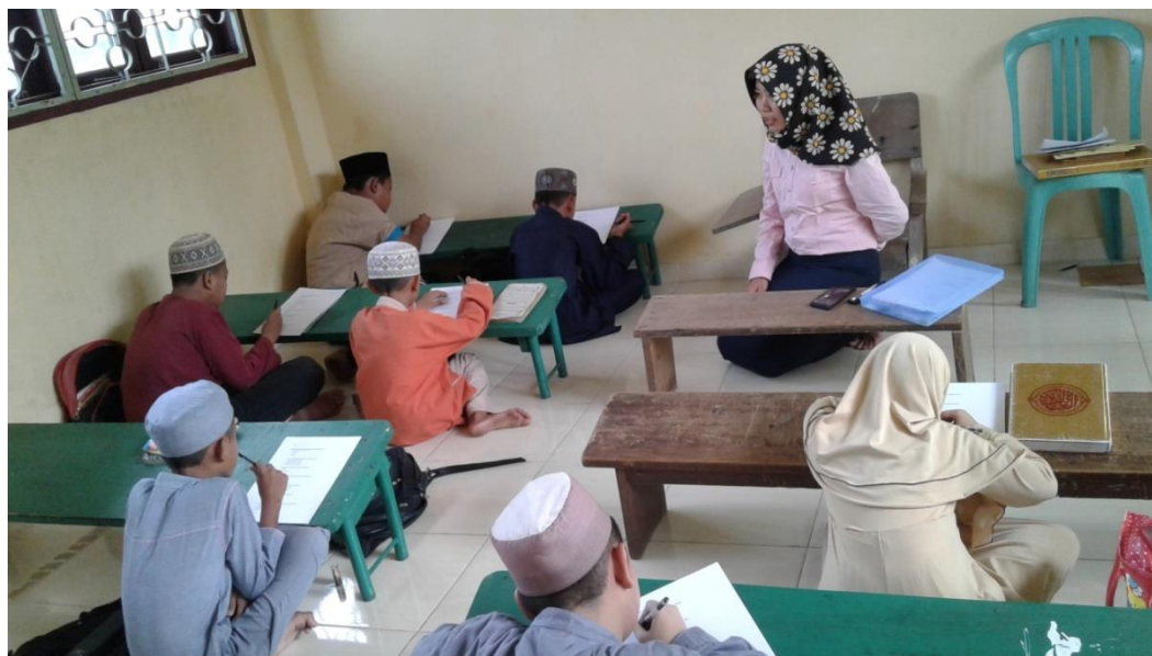
Pada saat pelaksanaan tes validitas keterbacaan di Masjid Raya Sekip