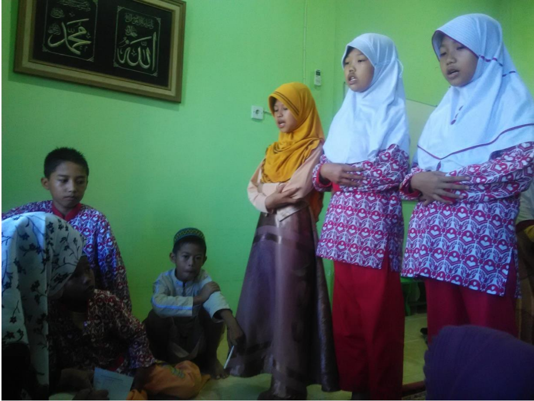
Saat Melakukan praktek sholat