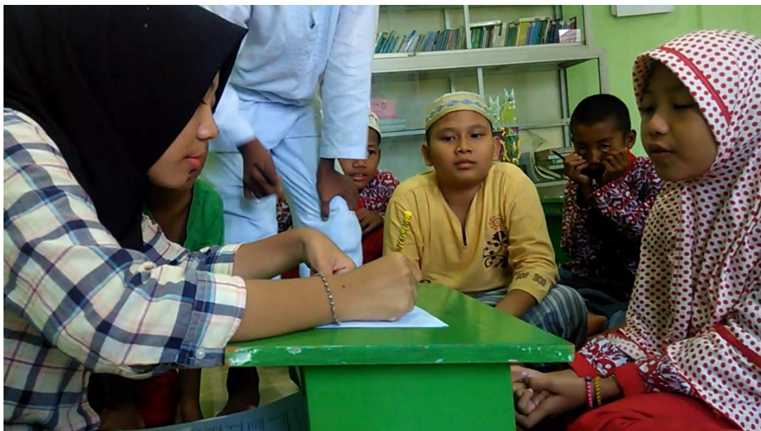
Tes Kemampuan Surat Pendek Tingkat Dasar