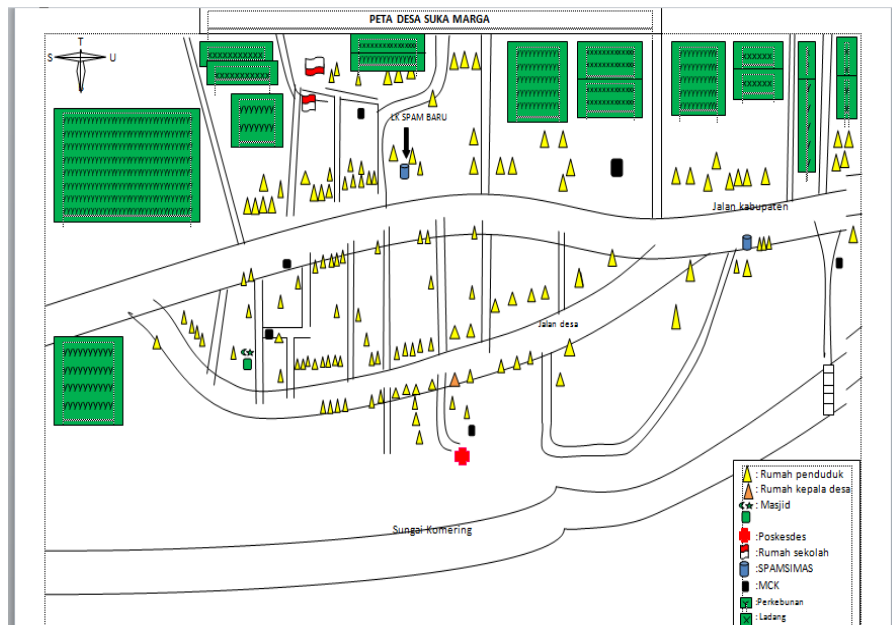
Peta Desa Sukamarga