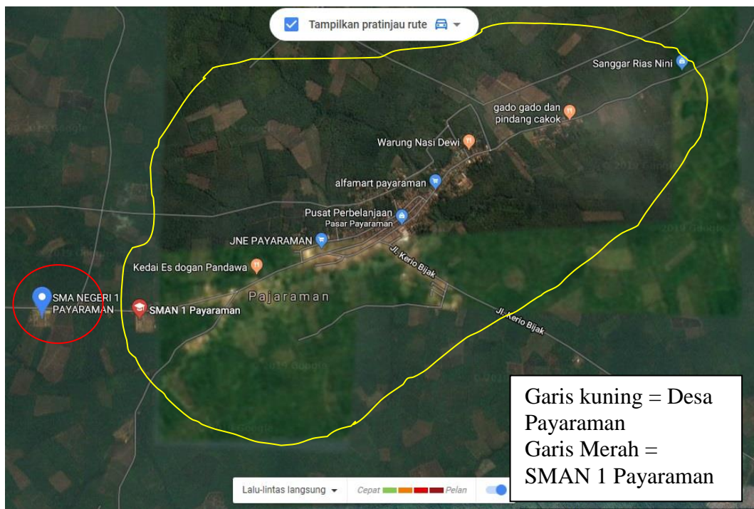
Gambar 2.1 Lokasi SMAN 1 Payaraman berdasarkan pantauan satelit

Lokasi penelitian ini adalah SMAN 1 Payaraman, beralamatkan di Jalan Lanang Kuaso Kelurahan Payaraman Barat, Kecamatan Payaraman, Kabupaten Ogan Ilir, Provinsi Sumatera Selatan. SMA Negeri 1 Payaraman berdiri di atas luas tanah milik 17.955 m 2 yang terletak 25 KM dari pusat kota Ogan Ilir dan 65 KM dari Kota Palembang.