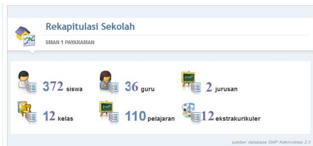
Gambar 2.2 Rekapitulasi Sekolah

Jumlah tenaga pendidik di SMAN 1 Payaraman berjumlah 31 orang guru, yang terkalsifikasi 11 orang guru laki-laki dan 20 orang guru perempuan. Sedangkan tenaga kependidikan yang berstatus Pegawai Negeri Sipil (PNS) dilingkungan SMAN 1 Payaraman sebanyak 5 orang, yang terdiri atas 3 orang guru perempuan dan 2 orang guru laki-laki. Total keseluruhan tenaga pendidik yang berada di SMAN 1 Payaraman berjumlah 36 orang tenaga pendidik, yang terdiri 13 guru laki-laki dan 23 guru perempuan. Dari jumlah seluruh siswa kelas X – XII di SMAN 1 Payaraman, perbandingan jumlah tenaga pendidik dengan siswa dapat dikategorikan cukup.