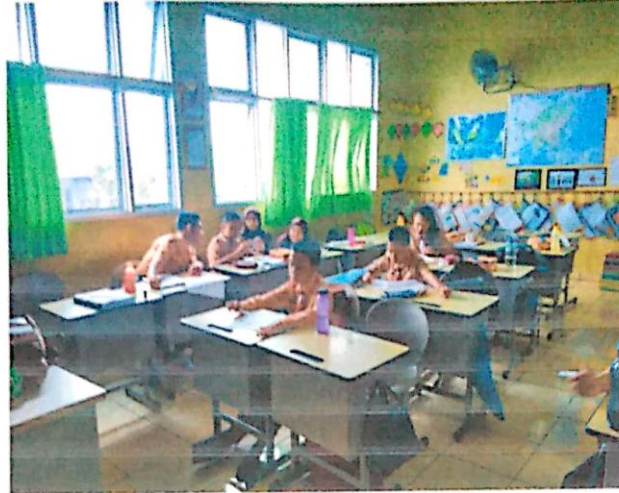
Ruang Baca Perpustakaan