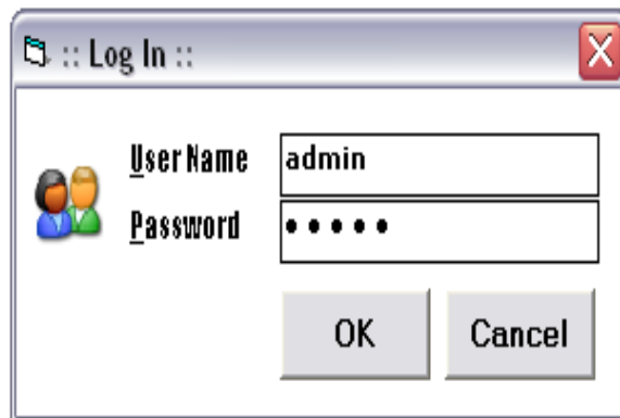
Gambar 4.1 Tampilan Form Login