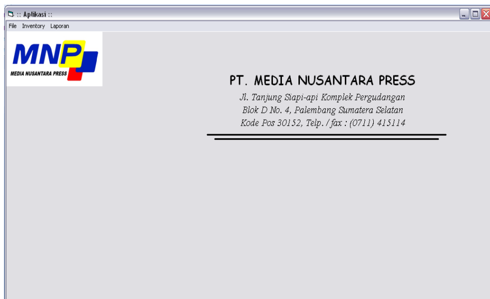
Gambar 4.2 Tampilan Form Menu Utama

Menu ini akan tampil setelah user berhasil login dan dikenali sebagai Admin. Di menu utama ini Admin dapat menginput file, data dan laporan.