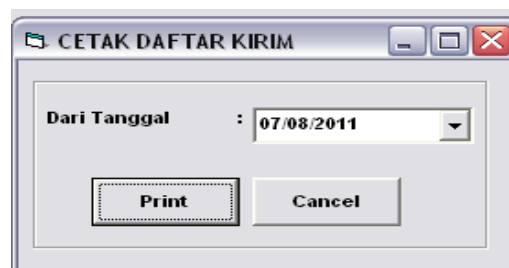
Gambar 4.11 Tampilan Form Cetak Daftar Kirim

Form ini berfungsi untuk mencetak laporan daftar kirim.