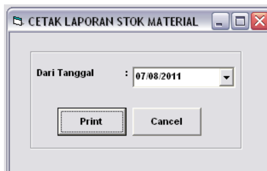
Gambar 4.12 Tampilan Form Cetak Laporan Stok Material

Form ini berfungsi untuk mencetak laporan stok material.