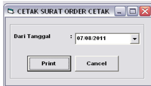
Gambar 4.10 Tampilan Form Cetak Surat Order Cetak

Form ini berfungsi untuk mencetak laporan order cetak.