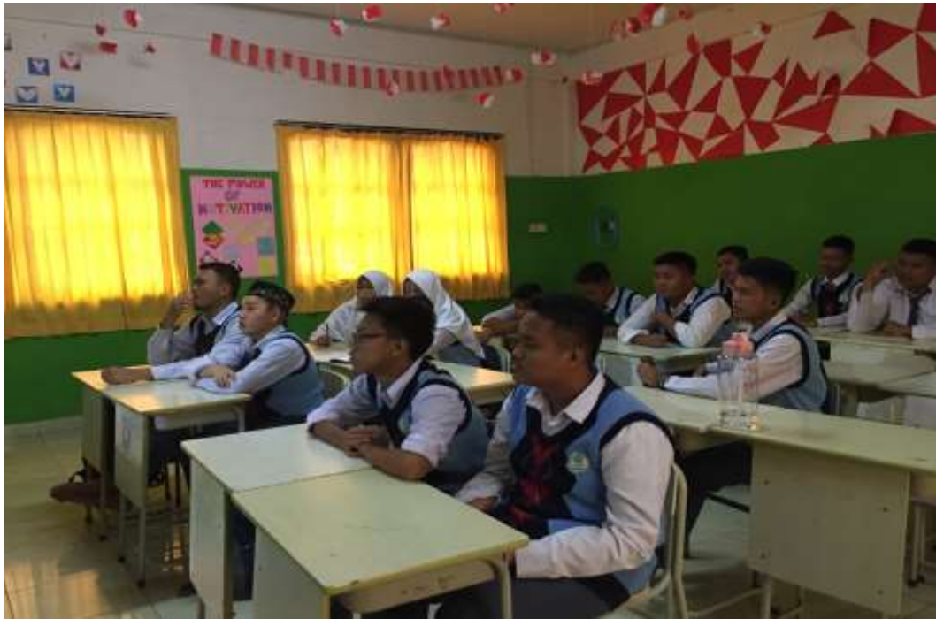
Dokumentasi Suasana Belajar Siswa