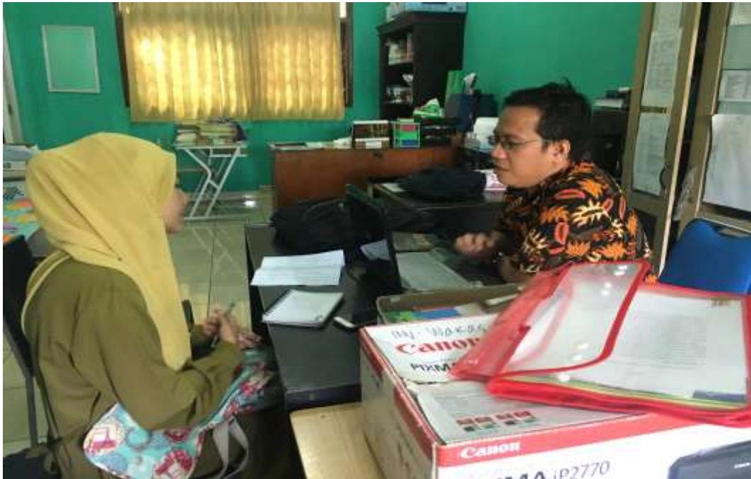
Dokumentasi Wawancara Dengan Guru Bahasa Arab