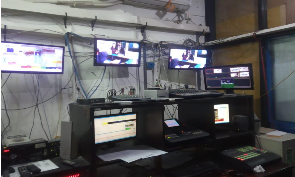
Gambar 3.4 Ruang Master Kontrol