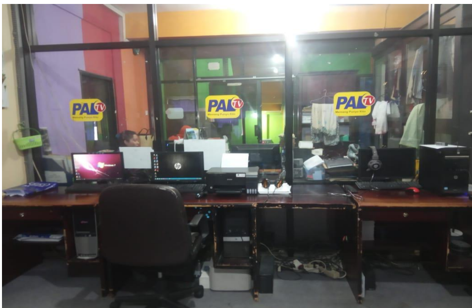
Gambar 3.2 Ruang Editing