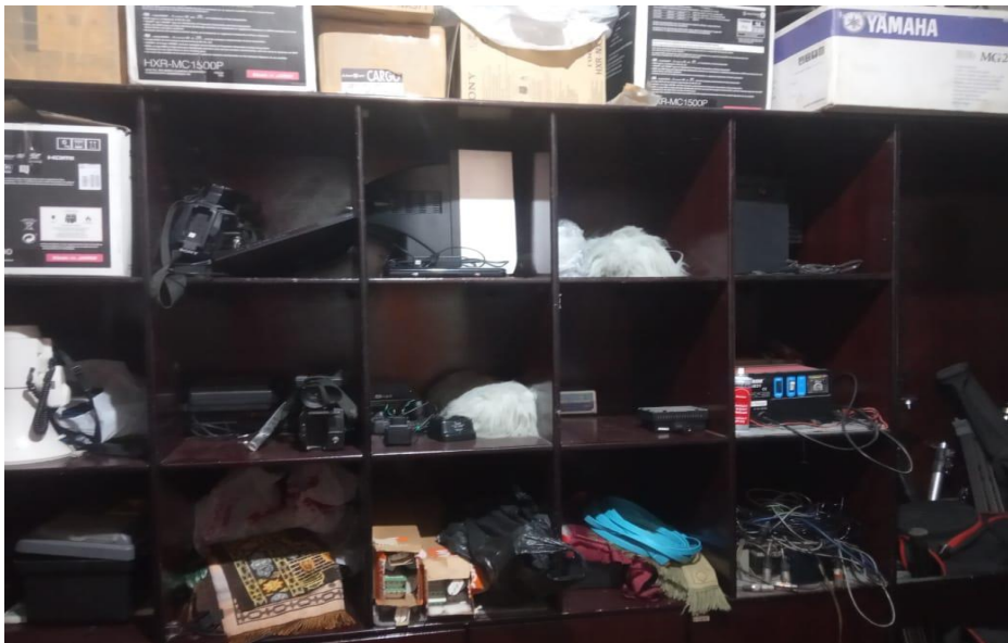
Gambar 3.1 Ruang Logistik