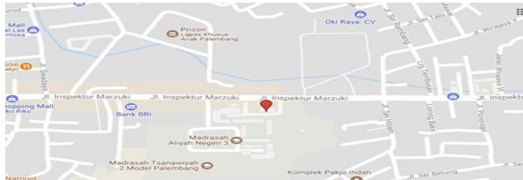
Gambar Peta Madrasah Tsanawiyah Negeri 1 Palembang