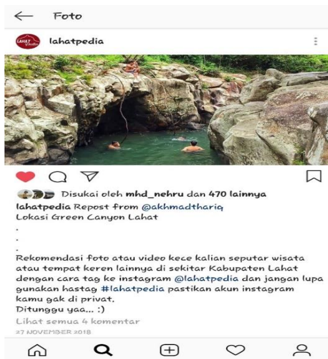
Gambar 2.2 Lokasi wisata : Green Canyon Lahat