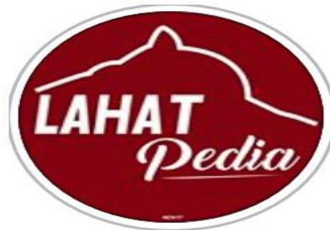
Gambar 2.1 Logo akun Instagram

Akun Instagram @lahatpedia berdiri pada tanggal 15 November 2017, sudah memiliki 14.500 pengikut ( followers ) di akunnya dan juga telah memposting 1756 unggahan foto yang berkaitan dengan travelling khususnya di kota Lahat. Akun @lahatpedia ini dikelola oleh dua orang yang bersifat individu tidak terikat dengan instansi tertentu. Menurut pembuat dan pengelola akun ini awalnya karena suka melihat foto-foto keren dengan background wisata di kota Lahat, karena sudah terlalu banyak menyimpan foto-foto tersebut akhirnya berkeinginan untuk membuat akun instagram tentang wisata di kota Lahat dengan tujuan ingin memperkenalkan tempat-tempat wisata menarik yang ada di Kabupaten Lahat.