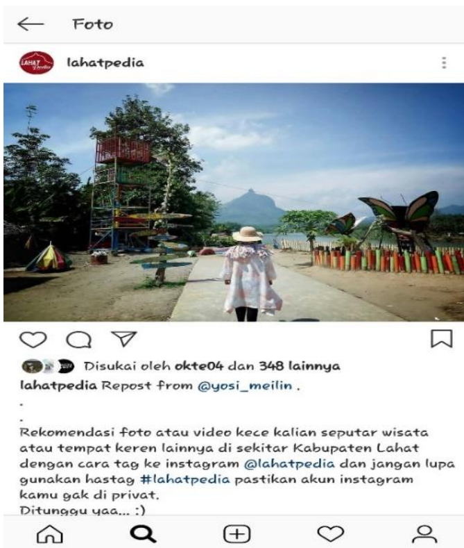
Gambar 2.3 Lokasi wisata : Plancu Lahat