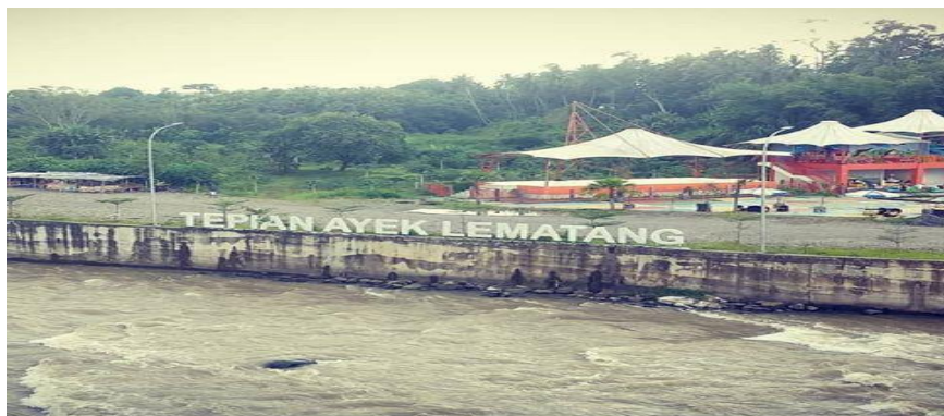
Gambar 2.8 objek wisata Tepian Lematang