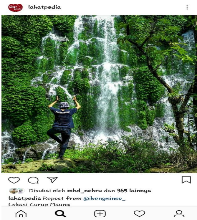
Gambar 2.4 Lokasi wisata : Curup Maung Lahat