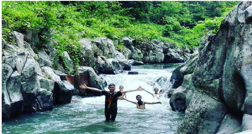
Gambar 2.9 objek wisata Green Canyon

Green canyon Lahat merupakan objek wisata berupa sungai yang dijaga bebatuan di sepanjang tepinya. Wisata ini tampak seperti green canyon yang berada di Amerika tetapi dalam versi lebih kecil. Airnya yang memancar berwarna hijau kebiruan dan tenang serta batu-batuan berwarna keabu-abuan. Lokasi wisata ini berada di Desa Pulau Pinang, Kecamatan Pulau Pinang, Kabupaten Lahat.