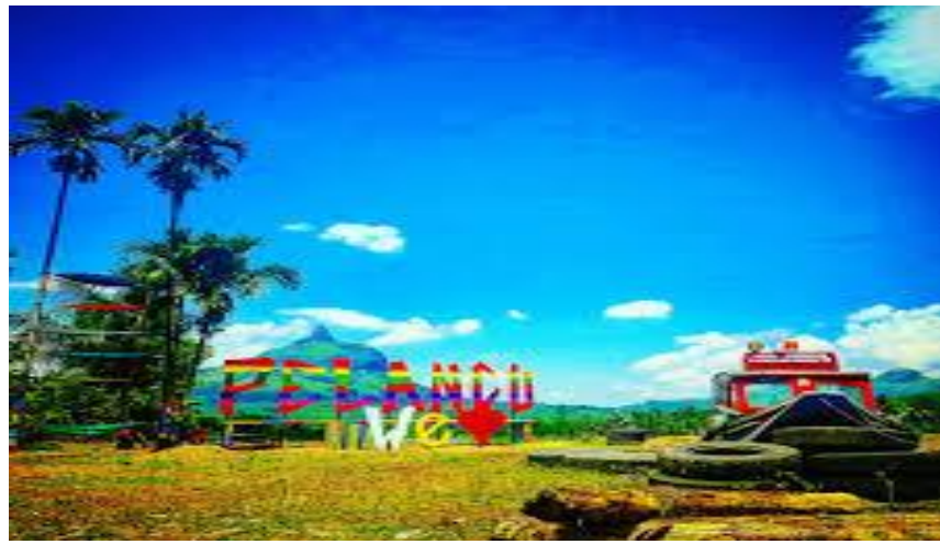
Gambar 2.6 objek wisata Plancu

Plancu merupakan wisata yang berada di tepian sungai lematang yang menonjolkan bukit jempol yang merupakan ikon Kabupaten Lahat. Wisata Plancu terletak di Desa Ulak Pandan, Kecamatan Merapi Barat, Kabupaten Lahat, Provinsi Sumatera Selatan. Objek wisata Plancu dibangun pada Agustus 2017 oleh masyarakat pemuda karang taruna Desa Ulak Pandan dan diresmikan pada tanggal 1 September 2017. Ada beberapa spot untuk berfoto diwisata pelancu yakni ayunan, kupu-kupu raksasa, perahu air, perahu ketek, dan wahana pulau batu untuk wisata air. Jarak tempuh lokasi Objek wisata pelancu ini dari pusat kota Lahat \pm 20 menit menggunakan kendaraan.