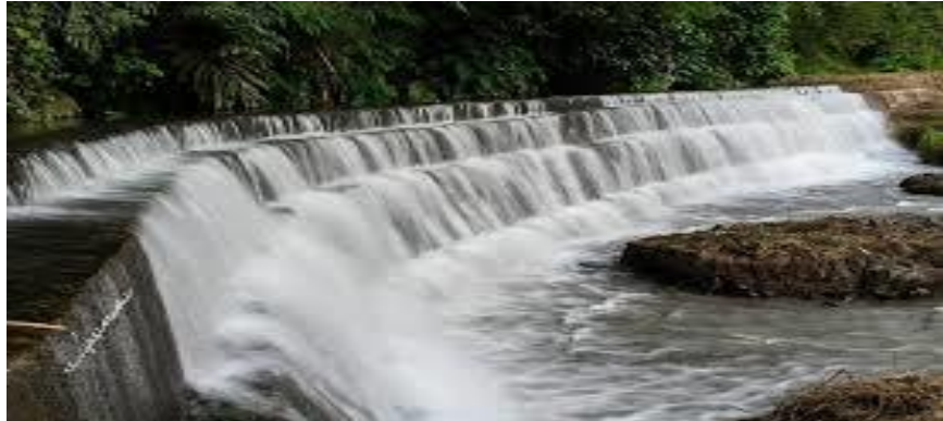
Gambar 2.7 objek wisata Tangga Manik

Tangga manik dahulunya merupakan sebuah bendungan air yang diberi nama “ Green Water Tangga Manik ” yang berada di Desa Tanjung Payang Kecamatan Lahat Selatan, Kabupaten Lahat. Dengan kreatifitas masyarakat yang di pelopori oleh Karang Taruna Setempat, sehingga kini dapat menjadi destinasi wisata bagi masyarakat dalam dan luar daerah. Bendungan air buatan ini letaknya tidak jauh dari pusat kota, jarak tempuh menggunakan kendaraan memakan waktu \pm 10 menit.