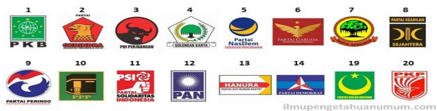
Gambar 3. Partai Peserta Pemilu 2019 di Kota Palembang

Dalam pemilihan umum 2019 di Kota Palembang terdapat 16 partai politik peserta pemilu yang berkompetisi memperebutkan posisi di pemerintahan, yaitu Partai Kebangkitan Bangsa (PKB), Partai Gerindra, PDIP, Partai Golkar, Partai Nasdem, Partai Garuda, Partai Berkarya, PKS, Partai Persatuan Indonesia, PPP, PSI, PAN, Partai Hanura, Partai Demokrat, Partai Bulan Bintang dan Partai Keadilan Persatuan Indonesia.