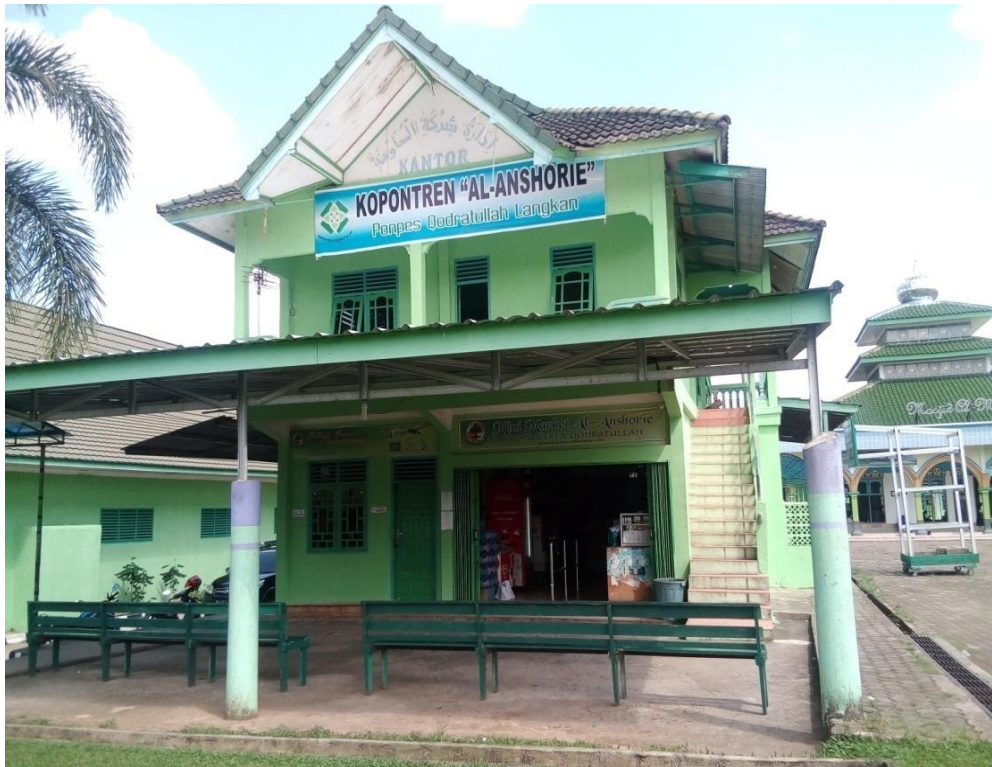
Gambar 3.1. Kopontren Qodratullah Banyuasin III

telah menetapkan dan mengesahkan Akte Pendirian Koperasi Pondok Pesantren Qodratullah (Kopontren Qodratullah) sebagai lembaga yang berbadan hukum dengan Akta Pendirian Kopontren Qodratullah nomor 003681/BH/VI/Tanggal 14 Januari 1997.