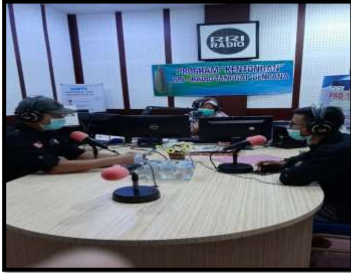
Pelaksanaan Dilaog RRI Tanggap Bencana