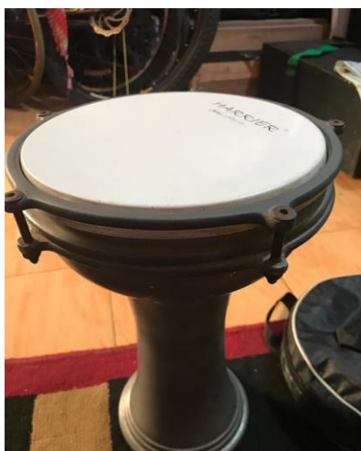
Gambar 5. Darbuka Tak