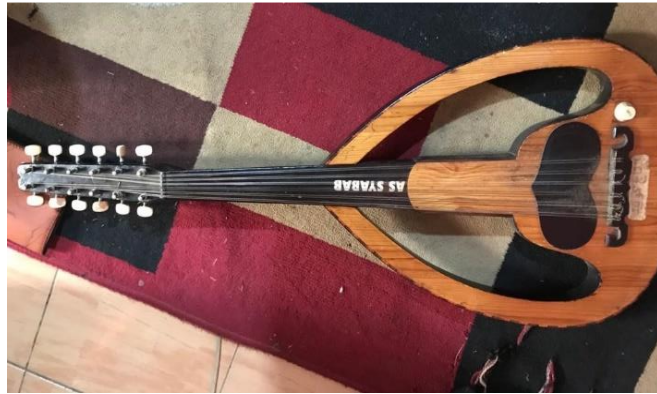
Gambar 3. Gitar Gambus

Gambus adalah alat musik petik yang berasal dari Timur Tengah, biasanya dibuat dari gabungan potongan-potongan kayu. Paling sedikit gambus dipasang 3 senar sampai paling banyak 12 senar. Gambus dimainkan sambil diiringi gendang.