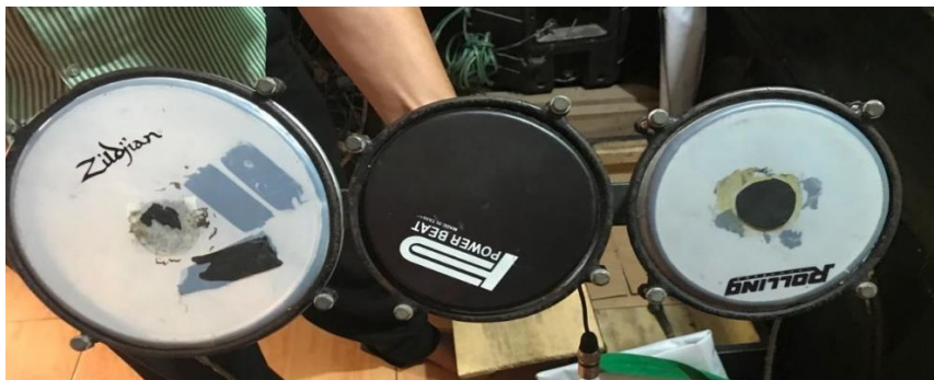
Gambar 7. Tam-Tam