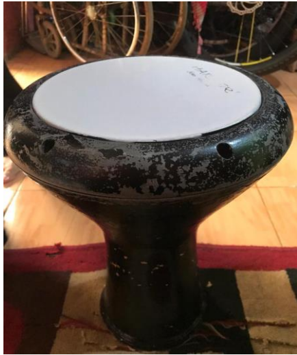
Gambar 4. Darbuka Dung

Darbuka termasuk dalam jenis alat musik perkusi yang berbentuk seperti piala, darbuka sendiri biasanya disebut juga dengan darbuka, debuka, dombek, dumbec atau tablah yang dimainkan dengan cara dipukul menggunakan kedua tangan kosong atau tidak menggunakan alat pukul (stick).