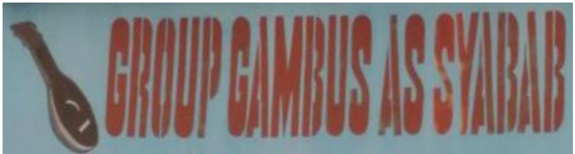
Gambar 1. Logo Grup Gambus As-Syabab