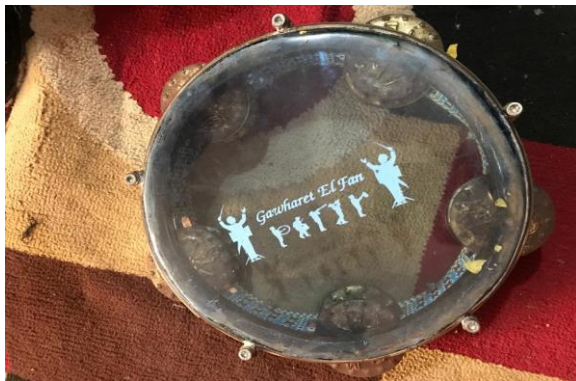
Gambar 6. Tamborin

Tamborin terbuat dari bingkai kayu bundar yang dilengkapi dengan membran pelapis dari kulit sapi atau plastik. Tamborin memiliki beberapa simbal atau kerincingan logam kecil di sekeliling bingkainya yang akan mengeluarkan bunyi bergemerincing bila alat musik ini digoyangkan.