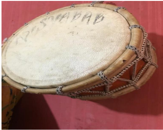
Gambar 8. Marawis

Marawis adalah salah satu jenis "band tepuk" dengan perkusi, membrannya terbuat dari kulit kambing dan badannya dari kayu cempedak. Marawis adalah alat musik ritmis di dalam kesenian orkes gambus yang ditemui tidak hanya di Aceh, namun juga di Melayu Deli, Riau, dan Kalimantan Selatan.