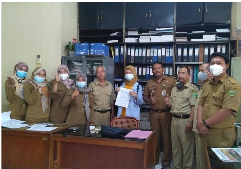
Foto Bersama Kasubbag. Keuangan Dinas Tenaga Kerja dan Transmigrasi Kota Palembang saat menyerahkan koersioner penelitian.