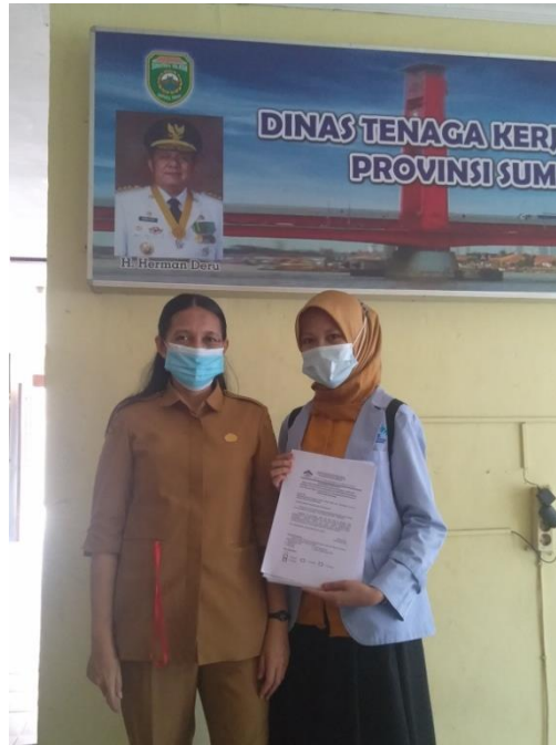
Foto Bersama Kepala Sub Bagian Umum dan Kepegawaian saat menyerahkan koesioner penelitian.