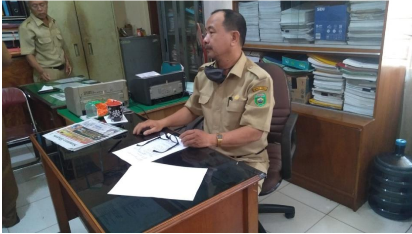
Foto pegawai Dinas Tenaga Kerja dan Transmigrasi Kota Palembang saat mengisi Koesioner penelitian.