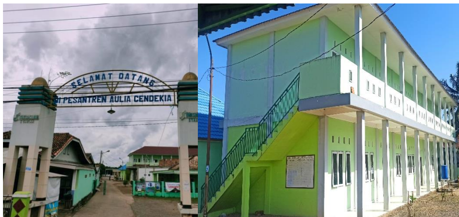
Gambar 1. Bangunan Pondok Pesantren Aulia Cendekia Palembang