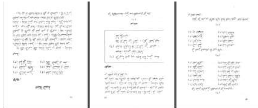
الصورة ٦. كتاب انحو الواضح

في هذا القسم يقدم الباحث الكتاب قبل تطويره باستخدام على أساس التعليم لتحليل المشكلات