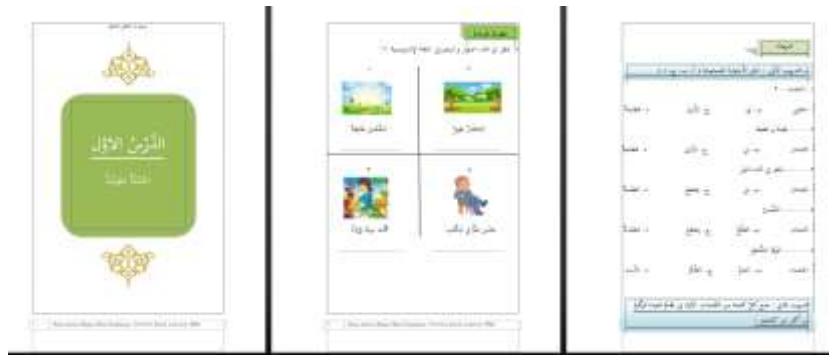
الصورة ٥. المواد و تدريبات

يوجد في هذا القسم أربعة الفصول من الدروس حيث يوجد في كل فصل مادة و تدريبات ، عرض المواد من كل فصل و أحد التدريبات كما يلي