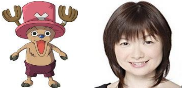
Gambar 8. Ikue Otani Sebagai Pengisi Suara Chopper