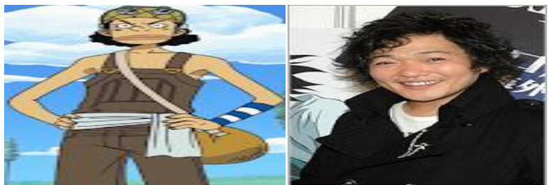
Gambar 6. Mitsuo Yamaguchi Sebagai Pengisi Suara Usopp