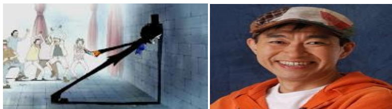
Gambar 11. Yuichi Nagashima Sebagai Pengisi Suara Brook