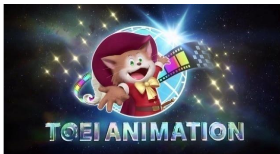
Gambar 1. Foto Logo Toei Animation