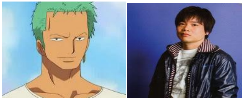
Gambar 4. Kazuya Nakai Sebagai Pengisi Suara Zoro