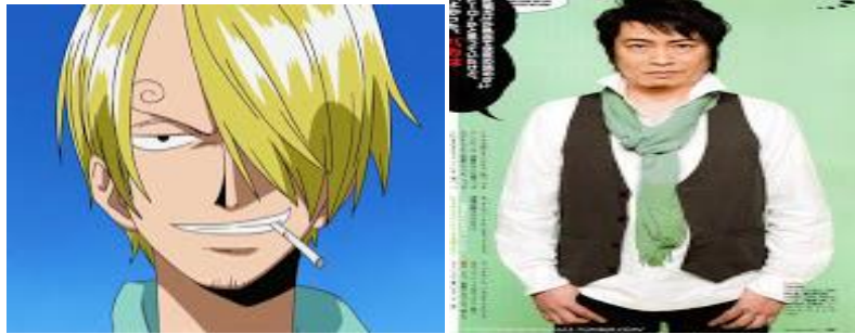
Gambar 7. Hiroaki Hirata Sebagai Pengisi Suara Sanji