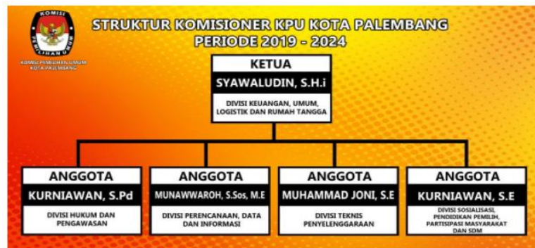
Gambar 2.3 Struktur Komisioner KPU Kota Paembang Periode 2019 – 2024

Secara lebih sederhana, struktur komisioner KPU Kota Palembang dapat dilihat pada gambar 2.3.