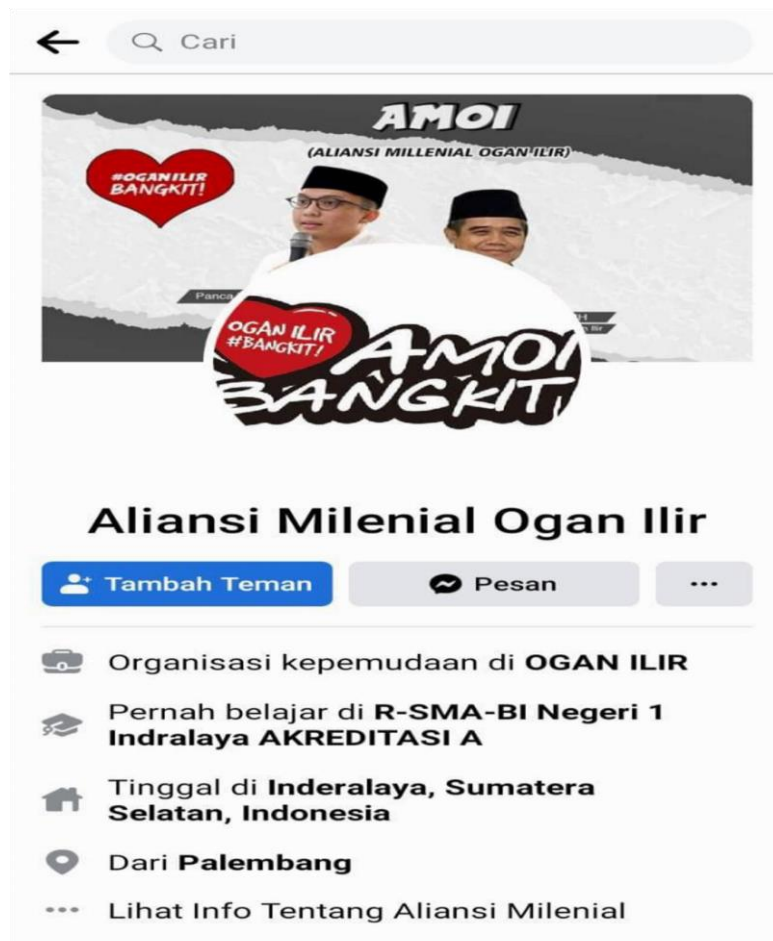
Gambar 4.7 Akun Facebook Aliansi Milenial Ogan Ilir.

maka dari itu mereka menggunakan social media instagram mereka untuk membangun citra-citra positif politik calon bupati nomor urut satu ini agar masyarakat Ogan Ilir mengetahui informasi-informasi mengenai calon bupati nomor urut satu .