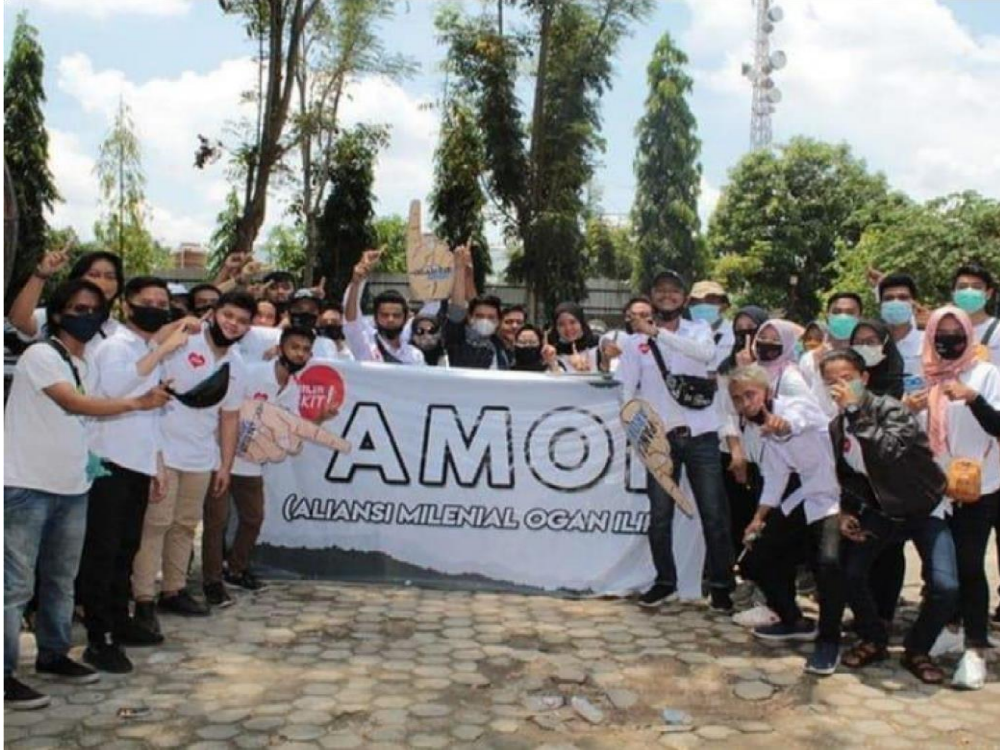
Gambar 4.10 foto bersama Anggota Aliansi Milenial Ogan Ilir.