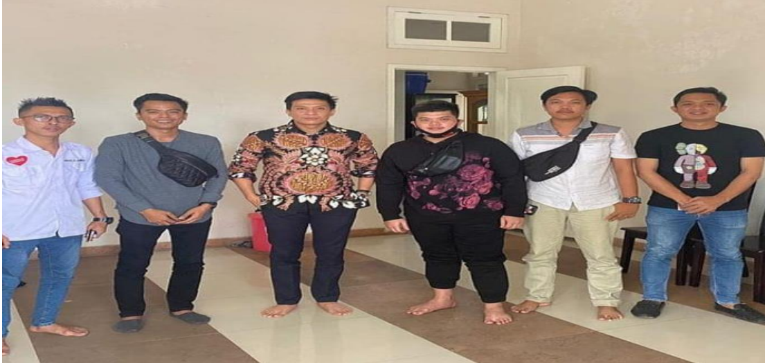
Gambar 4.8 Kepengurusan Inti Aliansi Milenial Ogan Ilir