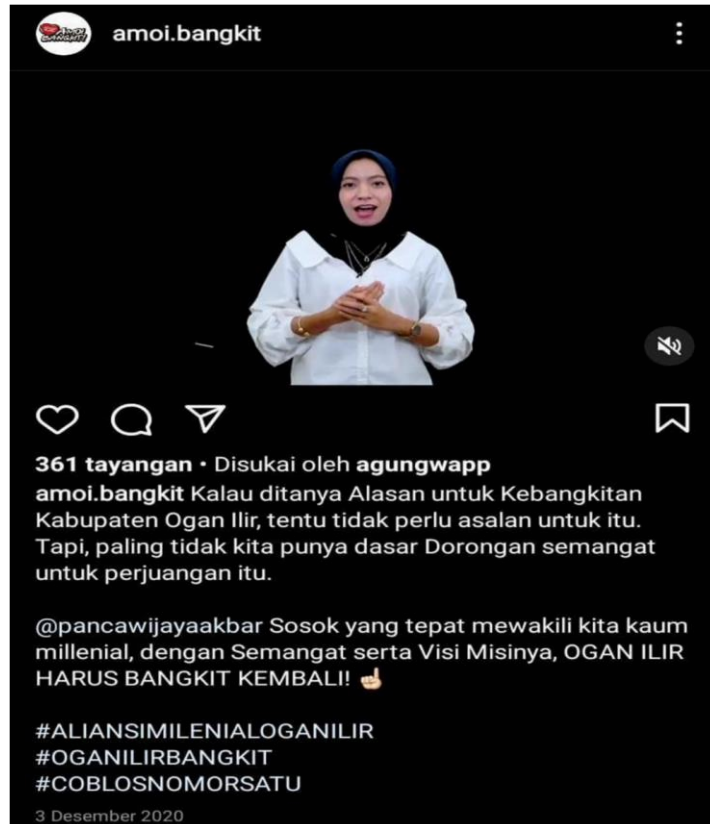
Gambar 4.2 Aliansi Milenial Ogan Ilir ketika melakukan broadcasting di social media.

Sumber: Instagram Aliansi Milenial Ogan Ilir.