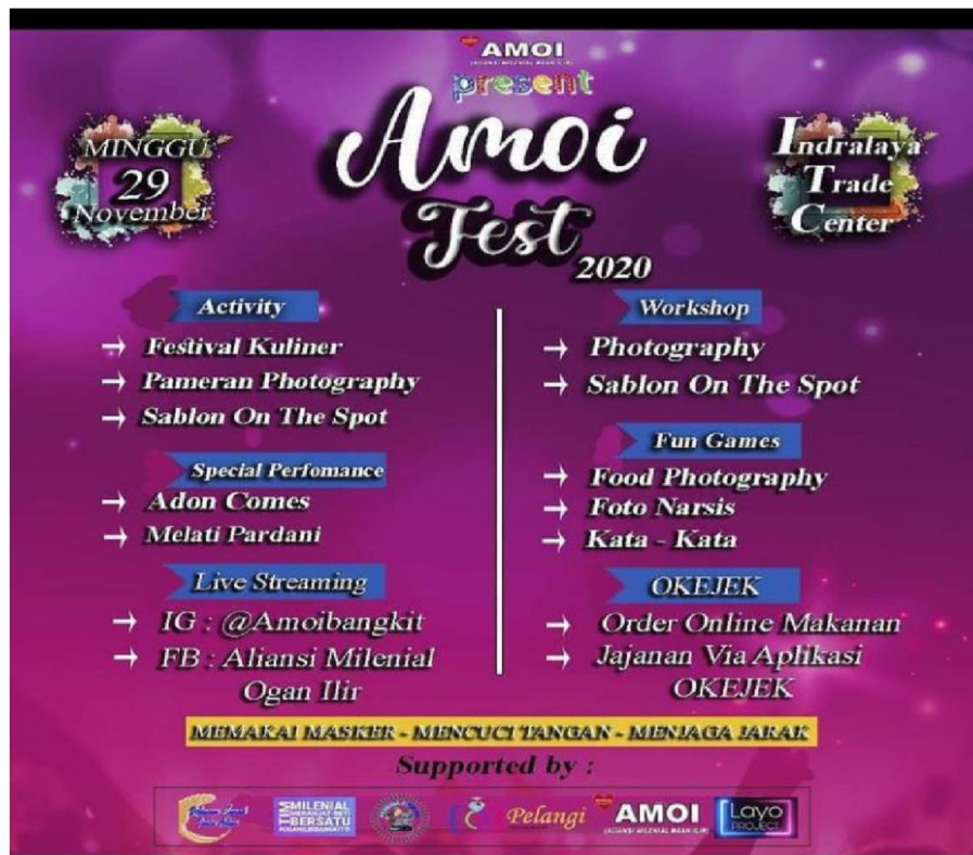
Gambar 4.4 Rangkaian Acara Program Amoi Fast .

acara yang sudah disusun oleh Aliansi Milenial Ogan Ilir semua berjalan dengan lancar dan menarik perhatian masyarakat Ogan Ilir.