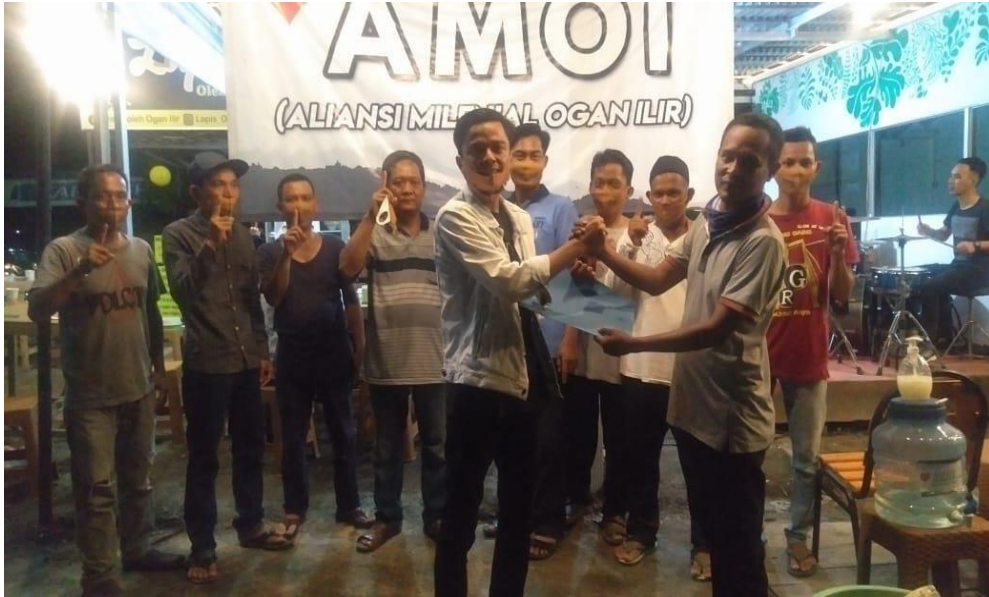
Gambar 4.5 Aliansi Milenial Ogan Ilir memberikan program bantuan sosial .

ketua Aliansi Milenial Ogan Ilir membantu petugas-petugas kebersihan di Ogan Ilir dengan memberikan sedikit bantuan sosial kepada petugas kebersihan tersebut berupa sembako seperti beras, mie instan, telur , gula dll