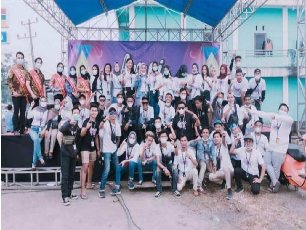
Gambar 4.3 Aliansi Milenial Ogan Ilir Melaksanakan Program Amoi Fast.