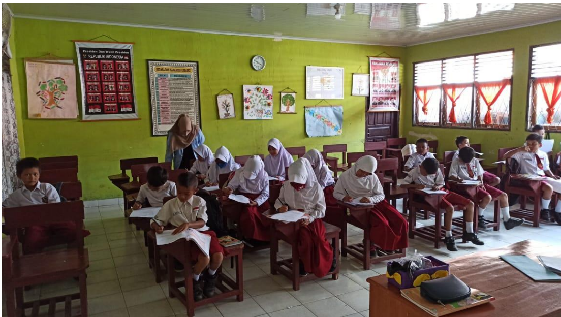
Pembelajaran pada Kelas IV B (kelas Eksperimen)