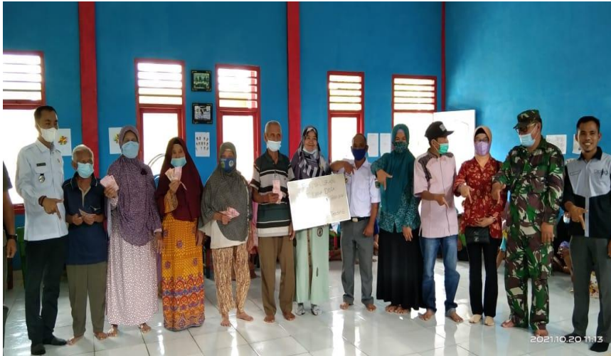
foto pembagian dana BLT Desa Lubuk Tanjung Kecamatan Muara Pinang Kabupaten Empat Lawang