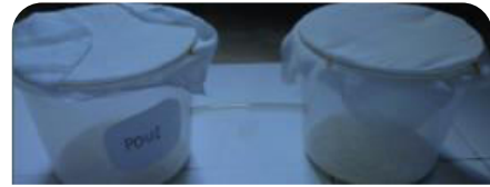
Gambar 1. Toples