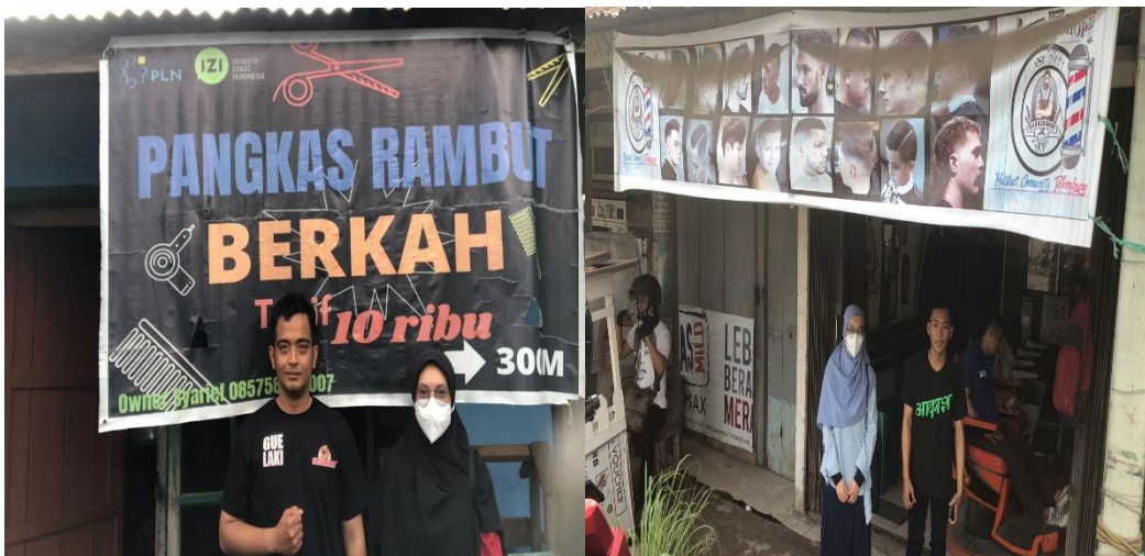
Salah satu Penerima Bantuan Pelatihan Pangkas rambut yang membuka usahanya di rumah dan yang satunya memilih untuk bekerja di tempat orang lain.