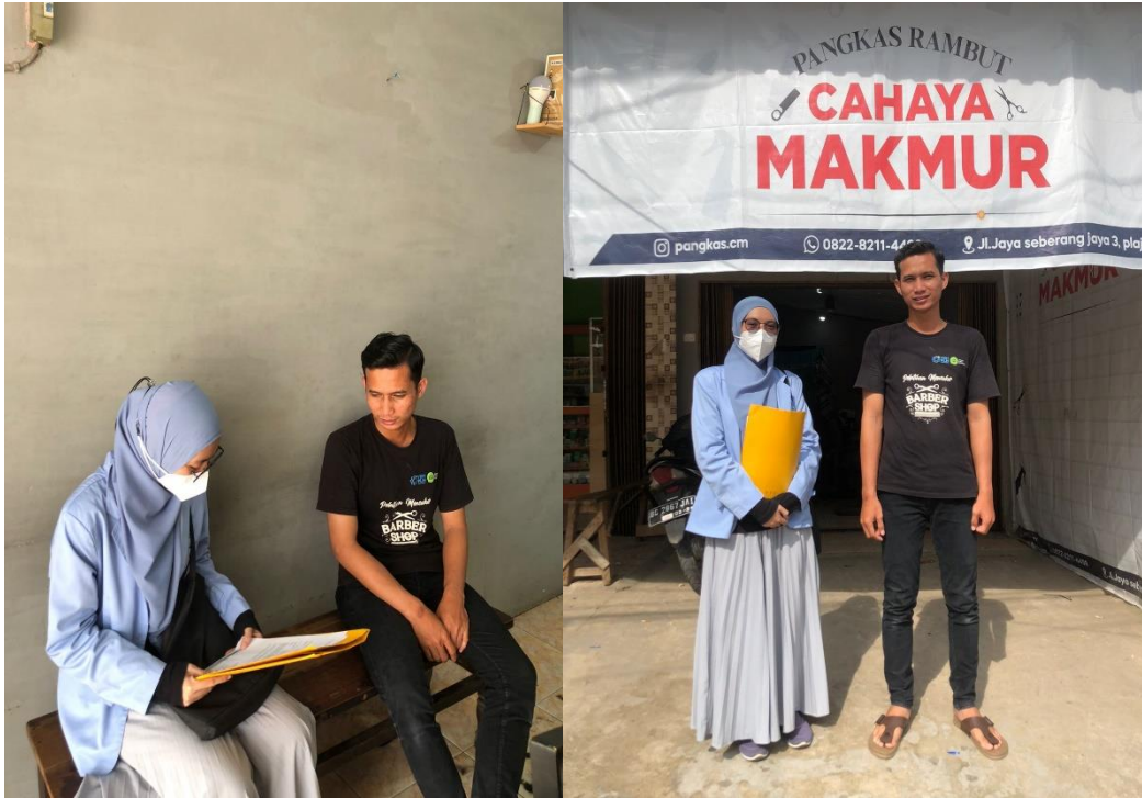
Wawancara dengan salah satu penerima bantuan pelatihan pangkas rambut ditempat usahanya sendiri