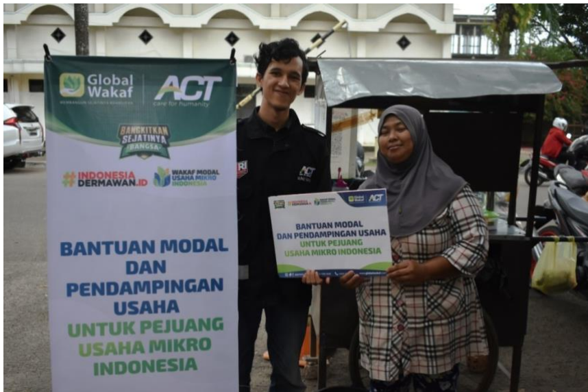
Penyerahan Bantuan Modal Program WMUMI