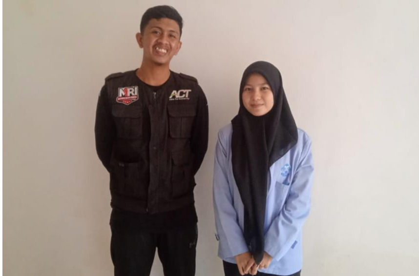
Wawancara dengan salah satu narasumber