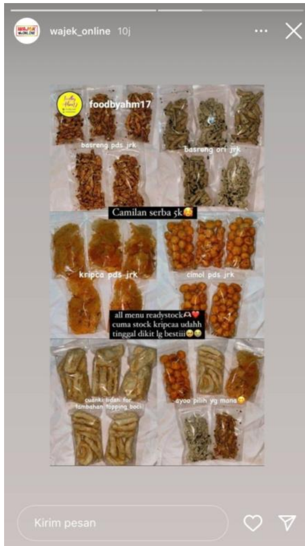
Gambar 12. Promosi Toko Pada Instagram Wajak