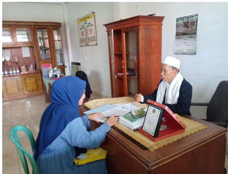
Gambar: Penyerahan SK Penelitian kepada Pimpinan Pondok Pesantren