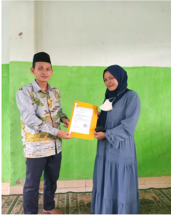
Gambar: Penyerahan SK Penelitian Kepada Pengasuh Asrama Putra