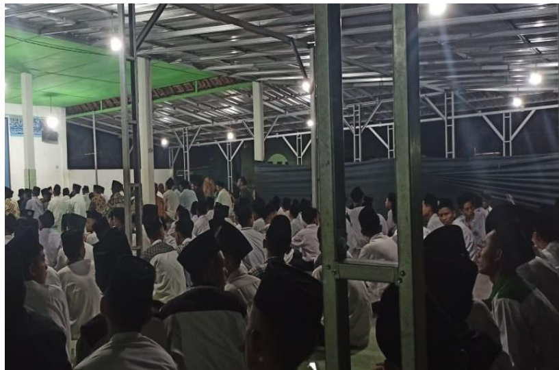
Gambar: Kegiatan Sholat Tahajud di Asrama Putra