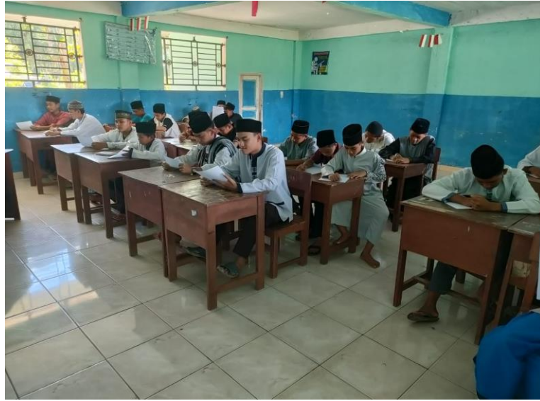
Gambar: Pengisian Kuesioner/ Angket oleh Santri Putra