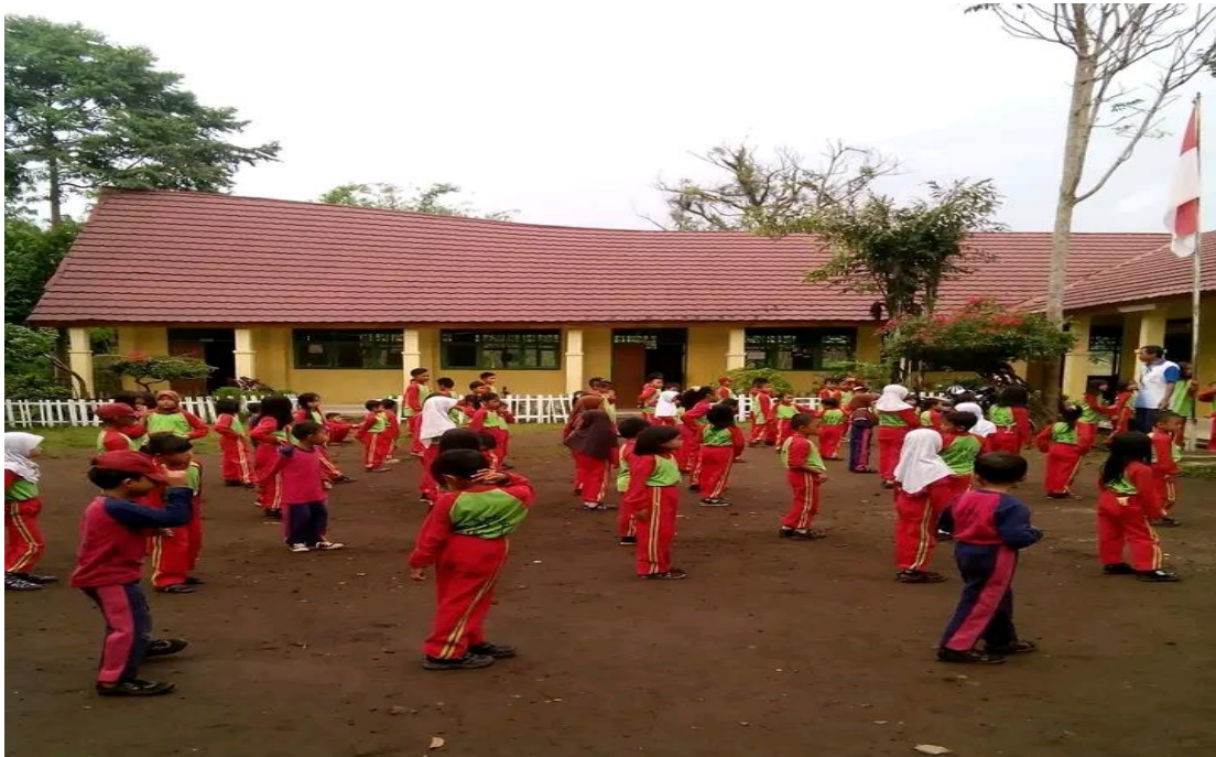
Gambar 4. Kegiatan Olahraga Bersama