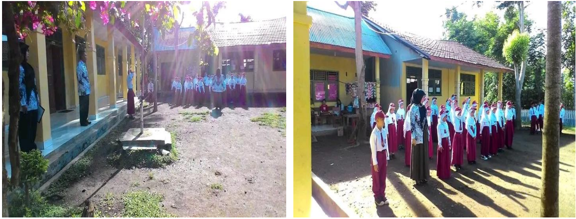
Gambar 3. Kegiatan Upacara Senin Pagi