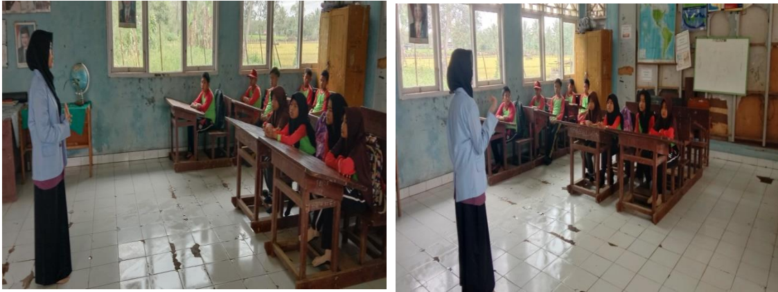
Gambar 1. Pembelajaran Tanpa Menerapkan Strategi Memori Matrix