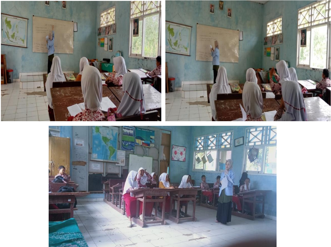
Gambar 2. Pembelajaran dengan Menerapkan Strategi Memori Matrix