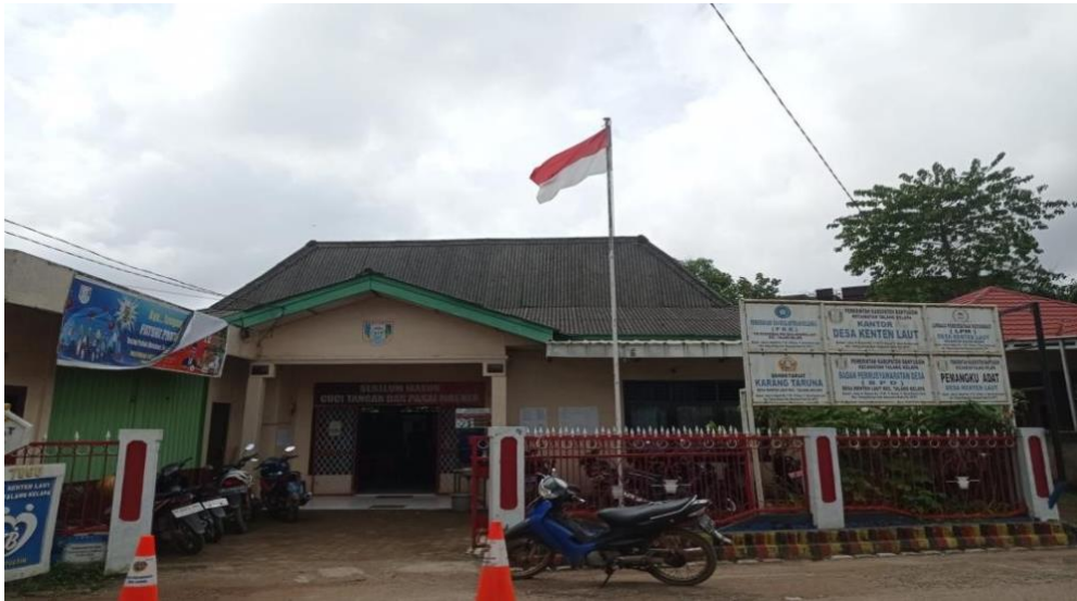
Gambar 1. Dokumentasi Kantor Desa Kenten Laut Kecamatan Talang Kelapa Kabupaten Banyuasin