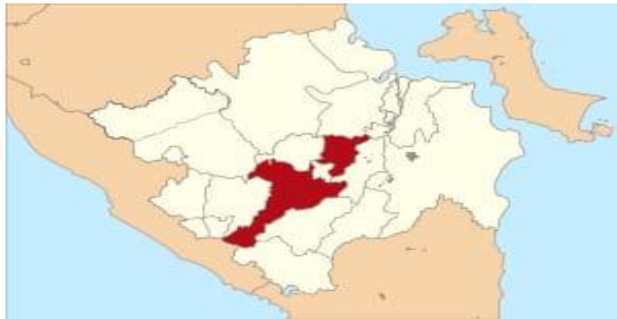
Gambar 4.1 Peta Lokasi Kabupaten Muara Enim di Sumatera Selatan