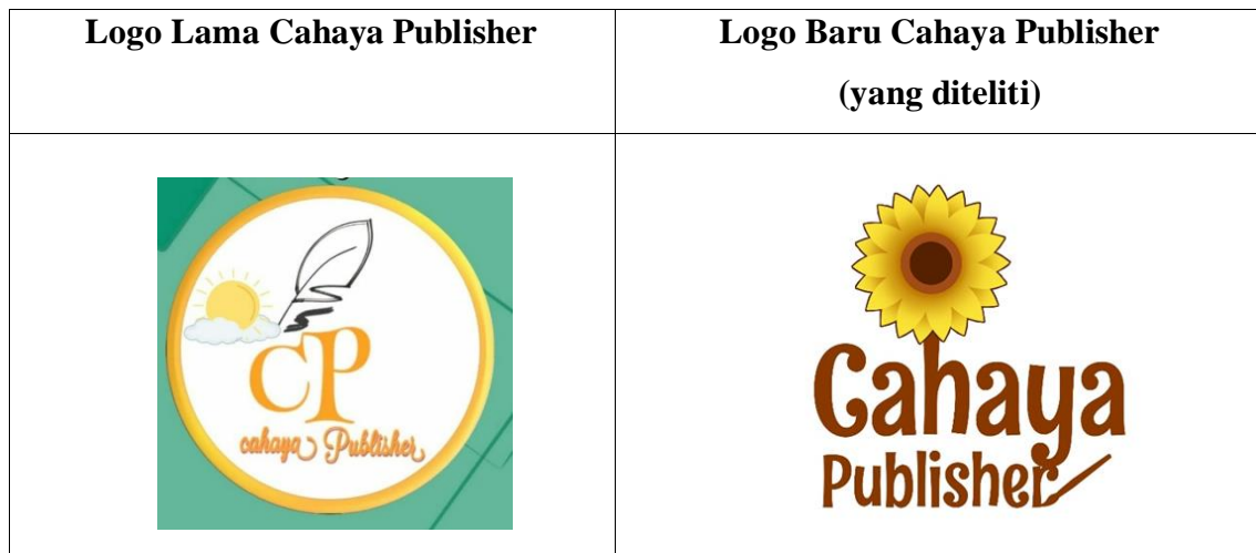
Tabel 4. 1 Logo Cahaya_Publisher