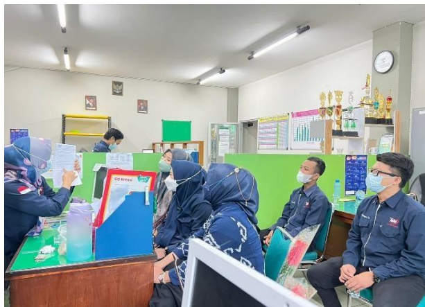
Gambar 4.5 Komunikasi dalam penjualan perorangan

Untuk memperkuat hasil wawancara dan observasi diatas, peneliti juga memberikan hasil dokumentasi terkait komunikasi dalam mempromosikan sekolah melalui personal selling . 174