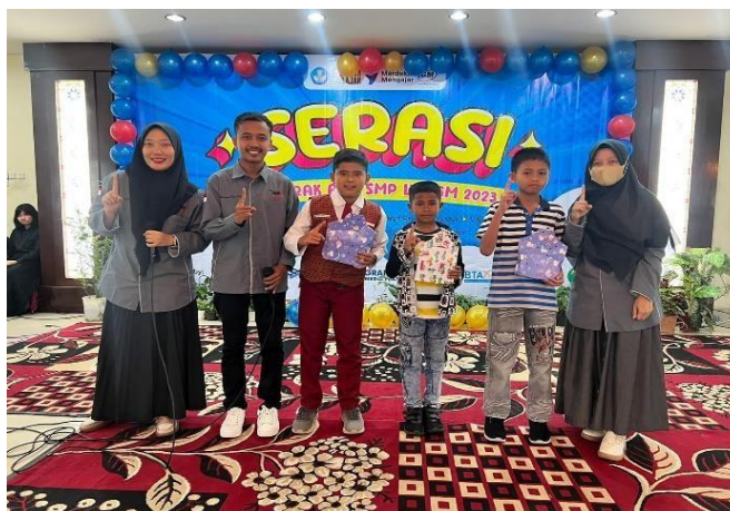
Gambar 4.7 Pengarahan dalam publisitas

Untuk memperkuat hasil wawancara dan observasi diatas, peneliti juga memberikan hasil dokumentasi terkait pengarahannya dalam mempromosikan sekolah melalui publikasi. 195