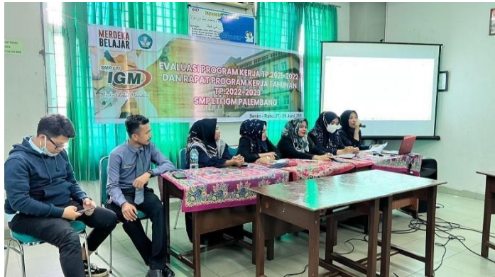
Gambar 4.6 Pengarahan dalam promosi penjualan

Dari hasil dokumentasi di atas menunjukkan pengarahan yang dilakukan oleh humas dengan pihak internal. Pengarahan yang dilakukan pada saat rapat sekolah dengan di arahkan kepada semua pihak agar dapat membantu dalam pelaksanaan promosi ini.