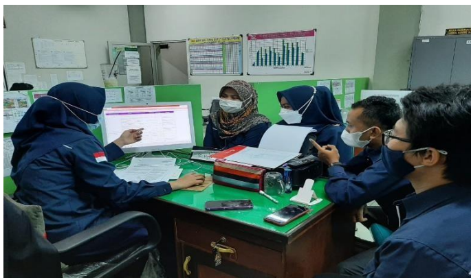
Gambar 4.3 Komunikasi dalam periklanan

Untuk memperkuat hasil wawancara dan observasi diatas, peneliti juga memberikan hasil dokumentasi terkait komunikasi dalam mempromosikan sekolah melalui periklanan. 153