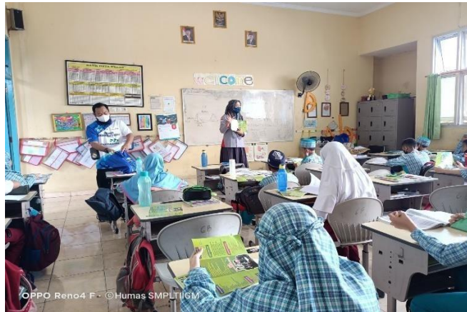
Gambar 4.8 Pengarahan dengan penjualan perorangan

Dari hasil dokumentasi di atas menunjukkan adanya pengarahan ketika melakukan penjualan perorangan dengan langsung datang ke sekolah dasar untuk bersosialisasi terkait dengan penerimaan pendaftaran peserta didik baru.