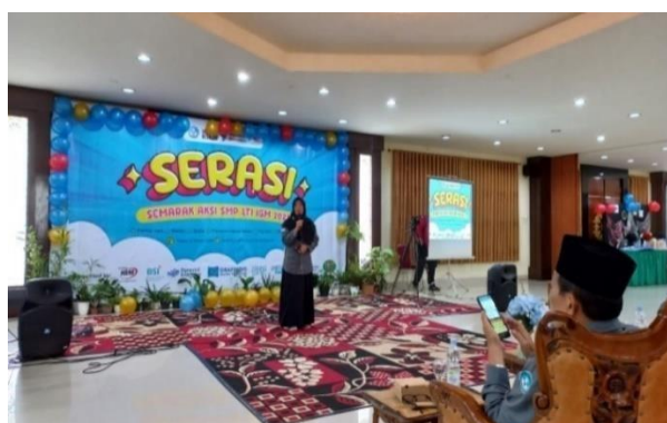
Gambar 4.2 Koordinasi dalam publisitas

Untuk memperkuat hasil wawancara dan observasi diatas, peneliti juga memberikan hasil dokumentasi terkait koordinasi dalam mempromosikan sekolah. 115