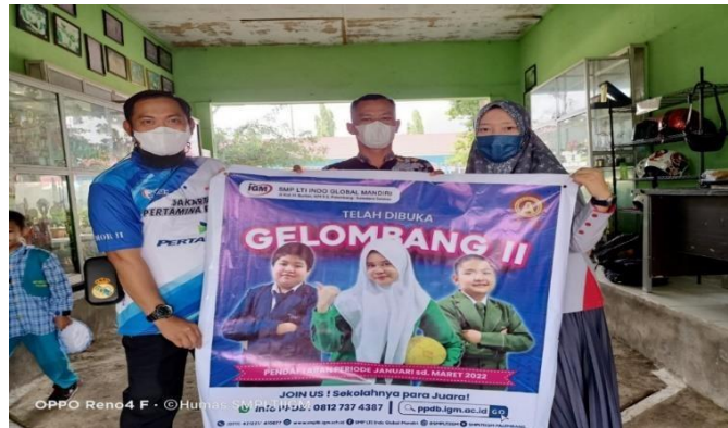
Gambar 4.4 Komunikasi dalam promosi penjualan

Dari hasil dokumentasi di atas menunjukkan komunikasi dengan melakukan promosi penjualan, komunikasi yang dilakukan dengan memberikan potongan harga kepada peserta didik dengan mengikuti gelombang II yang harganya lebih terjangkau.