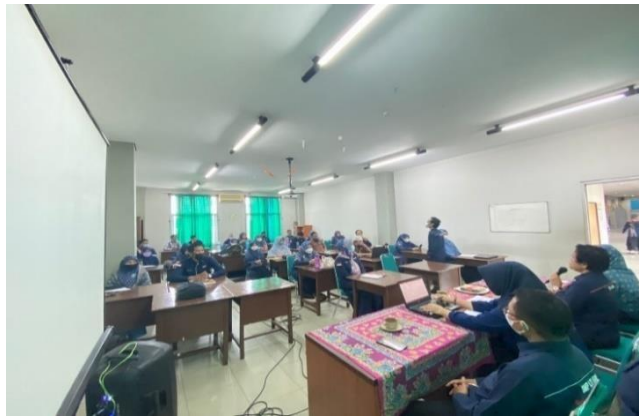
Gambar 4.1 Koordinasi dalam melakukan promosi penjualan

Dari hasil dokumentasi di atas menunjukkan koordinasi yang dilakukan kepada semua pihak internal sekolah melalui rapat sekolah dengan membahas promosi penjualan untuk menarik minat peserta didik dan masyarakat dengan memberikan potongan harga dan diskon.