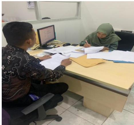
Foto Bersama Para pimpinan bank muamalatKcpBaturaja