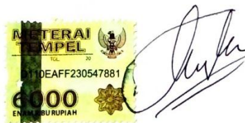
Alfian Absor Mukmin NIM.14290008

Palembang, 4 September 2018 Yang membuat pernyataan