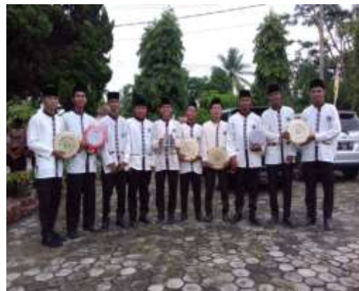
Kegiatan Ekstrakurikuler Hadroh Setiap Hari Sabtu