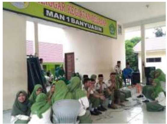
Tempat latihan di gazebo MAN 1 Banyuasin