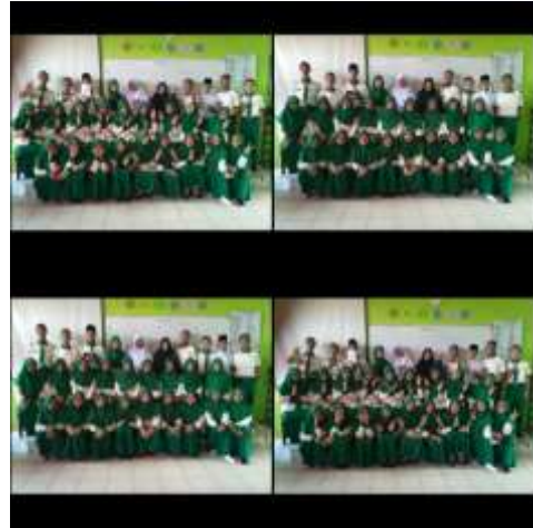
Foto Bersama Siswa Siswi Kelas XI IPA III