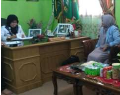
melakukan wawancara dengan Kepala Sekolah MAN 1 Banyuasin