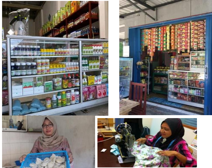
Gambar 2 : pekerjaan atau usaha sampingan petani bibit