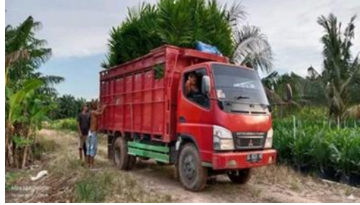
Gambar 4: pendistribusian bibit keluar kota