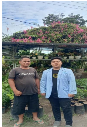
Gambar 1: petani bibit