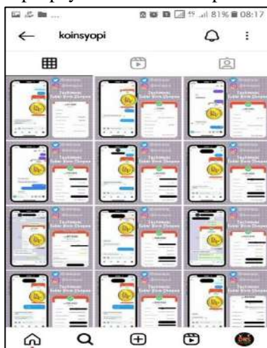
Gambar 5 : Testimoni penukar (pengguna jasa)