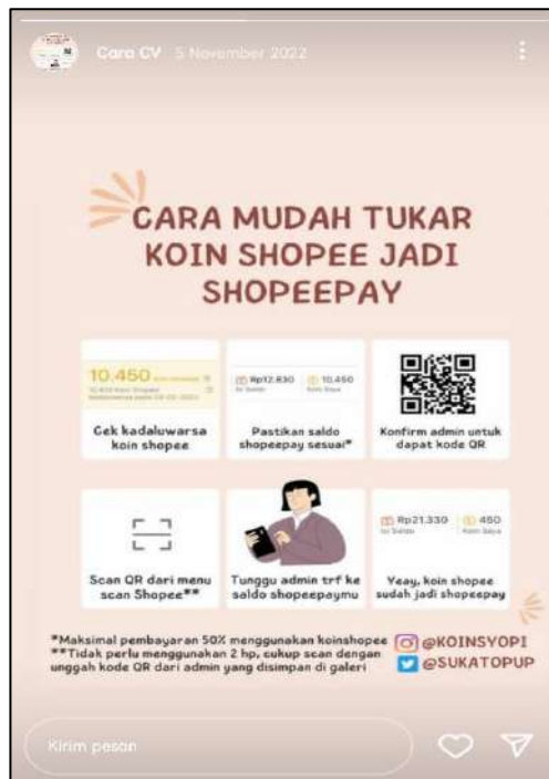
Gambar 3 : Transaksi tukar koin shopee

Pada profil akun @koinsyopi terdapat keterangan 50 postingan testimoni penggunaan jasa yang menggunakan jasa penukaran dari akun @koinsyopi, jumlah pengikut yang mengikuti berjumlah 277 akun, sedangkan @koinsyopi mengikuti akun lain sejumlah 281. Akun @koinsyopi menyertakan keterangan di Bio mengenai admin atau ownernya yakni @resoliarw, APK premium sharing privat, dan juga penukaran koin shopee (yang akan dikirim melalui shopeepay, dana, gopay, ovo, rek bank). Penukaran koin shopee pada akun instagram @koinsyopi bisa digunakan pada Smartphone Android maupun IOS .