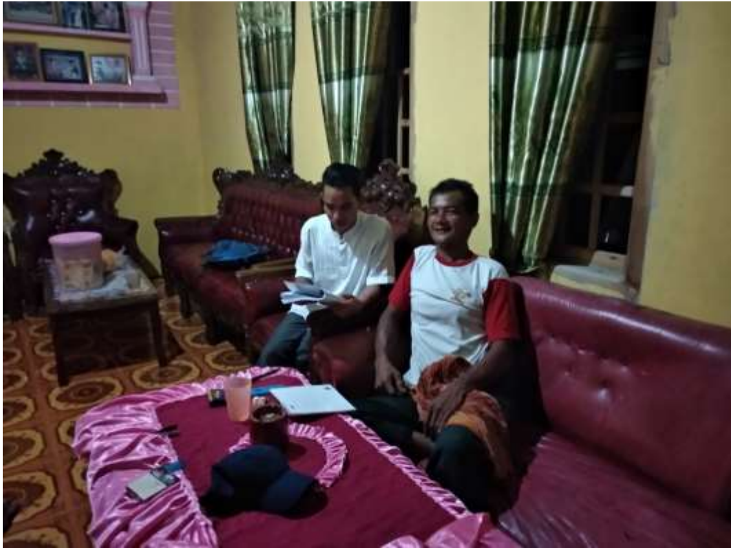
Penulis saat wawancara dengan masyarakat Desa Payabenua