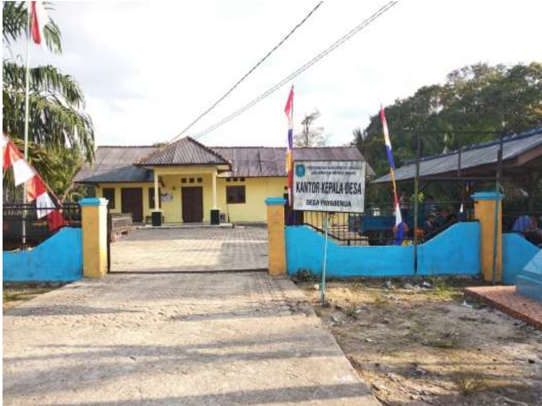
Observasi ke Kantor kepala Desa Payabenua Bangka