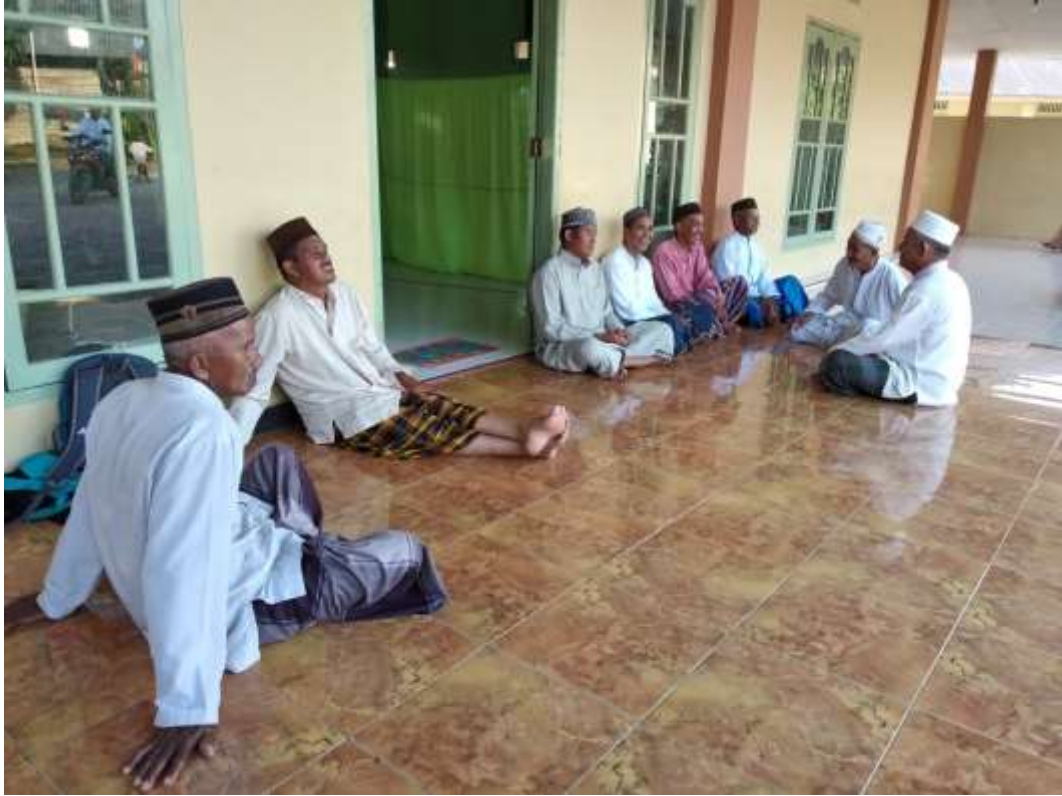
Kepala Desa Payabenua dan para pengikut Tarekat Tijaniyah sebelum memulai acara wirid Hailalah .