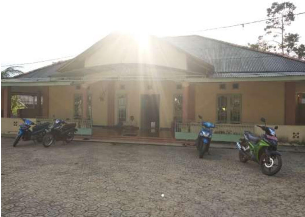
Observasi ke Wazifah Tarekat Tijaniyah di Desa Payabenua