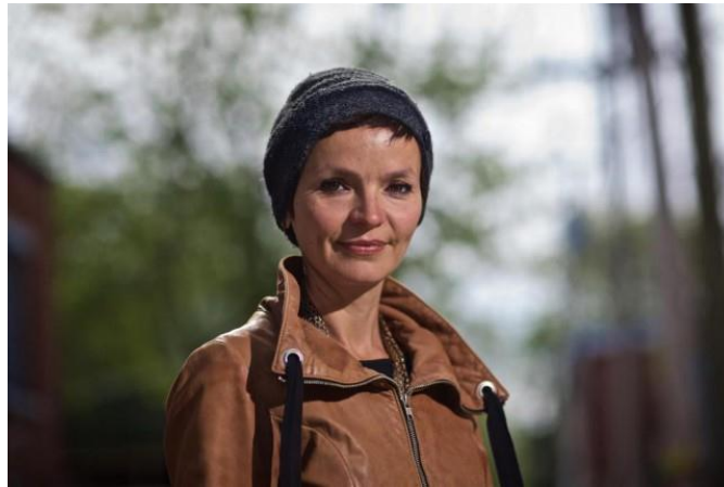
Gambar 3.2 Foto Anais Barbeau-Lavalette

Nama : Anais Barbeau-Lavalette Tempat/Tanggal Lahir : Montreal Kanada, 8 Februari 1979 Profesi : Novelis, Sutradara Film dan Penulis Skenario Kewarganegaraan : Kanada