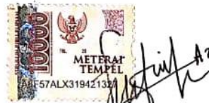
Fathima Az Zahra