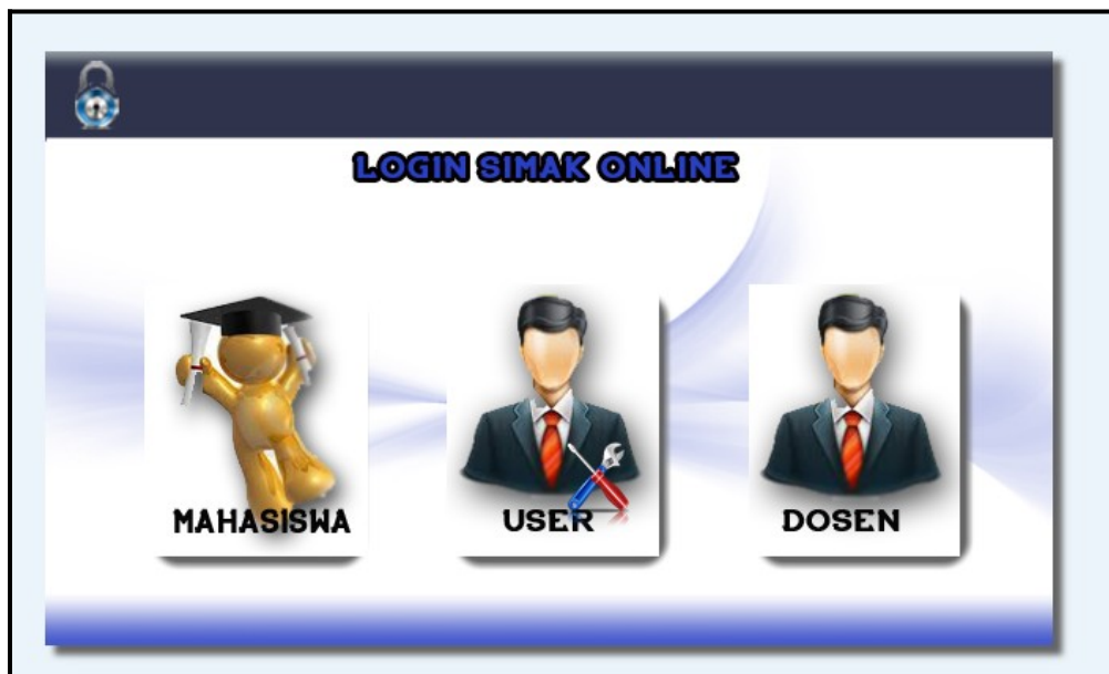
Gambar 4.1 Halaman Login Sistem