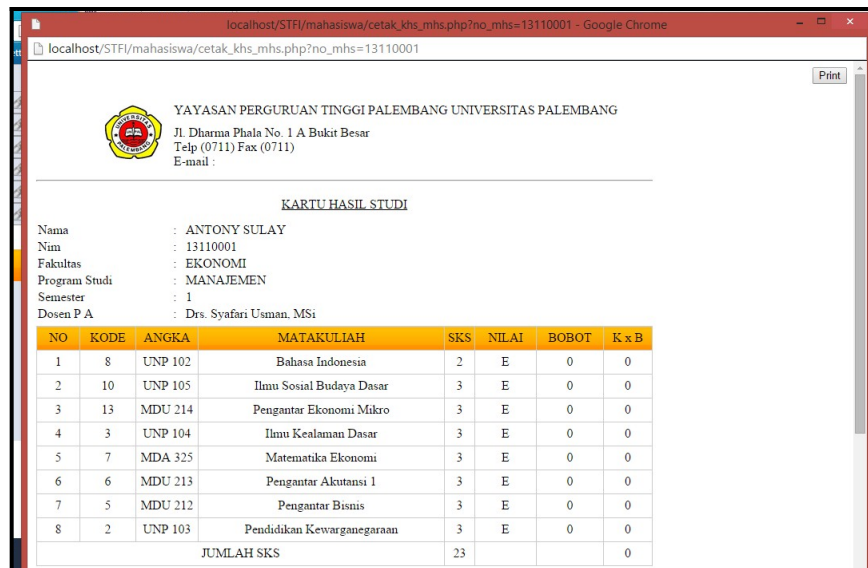
Gambar 4.26 tampil KHS