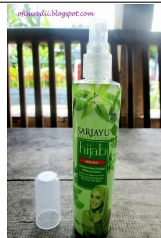
Gambar 3.2 Produk Martha Tilaar Sariayu Hijab Hair Care

Hair Mist Mengharumkan dan menjaga kehitaman rambut