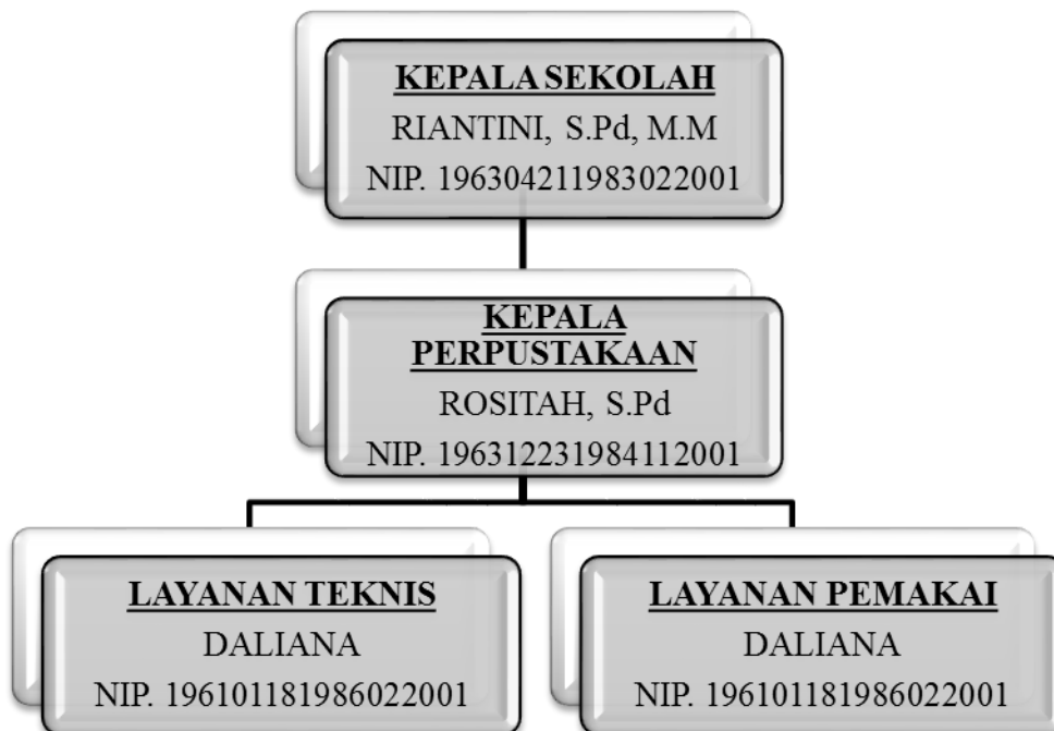
Gambar 2 Struktur Organisasi Perpustakaan SMP Negeri 1 Prabumulih

Struktur organisasi merupakan mekanisme formal untuk pengelolaan diri dengan pembagian tugas, wewenang, dan tanggung jawab yang berbeda. Struktur organisasi Perpustakaan SMP Negeri 1 Prabumulih sebagai berikut: 93