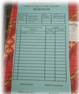
Gambar 3 Kartu Anggota Perpustakaan