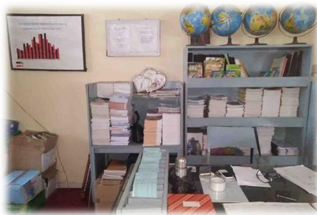
Gambar 5 Layanan Sirkulasi

mengembalikan buku. Perpanjangan masa peminjaman dilakukan sebanyak satu kali.