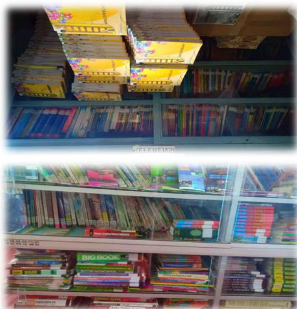
Gambar 7 Koleksi Referensi Perpustakaan SMP Negeri 1 Prabumulih

Layanan referensi terdapat berbagai macam koleksi yang tersedia, diantaranya surat kabar, kamus, dan peta. Pada koleksi referensi pemustaka tidak diizinkan untuk meminjam koleksi tersebut tetapi hanya boleh membaca ditempat.