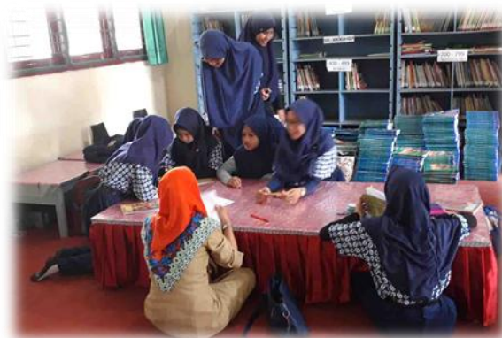
Gambar 6 Ruang Baca Perpustakaan SMP Negeri 1 Prabumulih