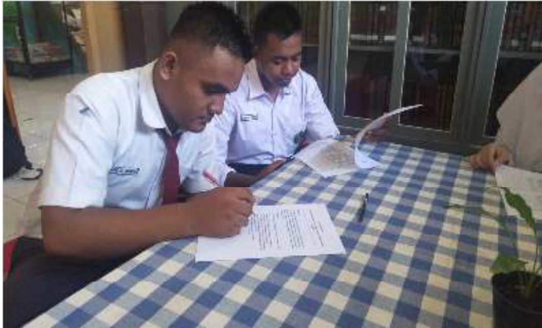
Dokumentasi pengisian angket penelitian oleh siswa di Perpustakaan MAN 3 Palembang